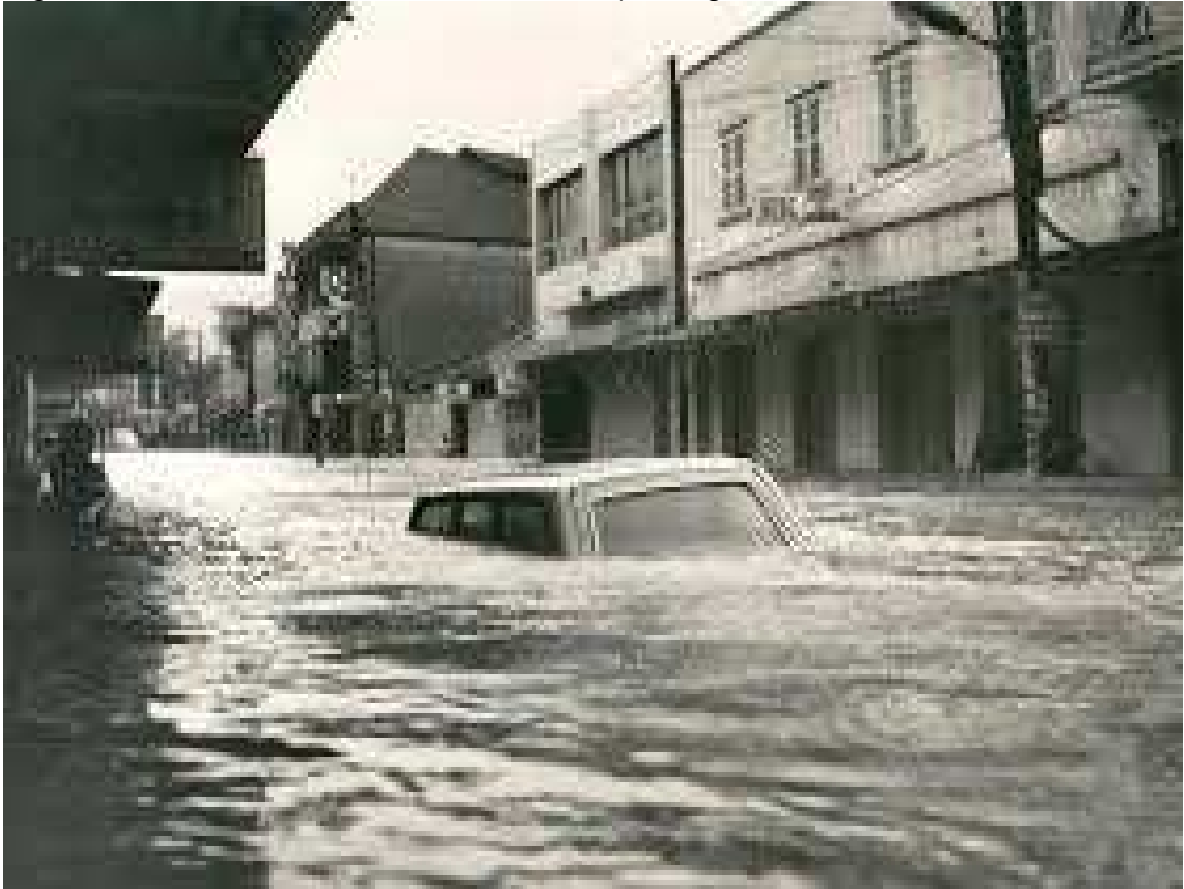
Figura 7 - Enchente de 1974 na Rua Henrique Lage