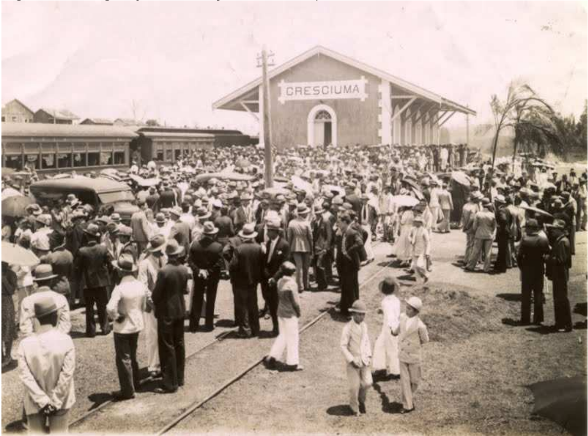
Figura 6 - Inauguração da estação de embarque em Criciúma