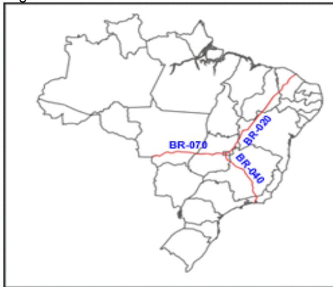
Figura 1- Rodovias Radiais