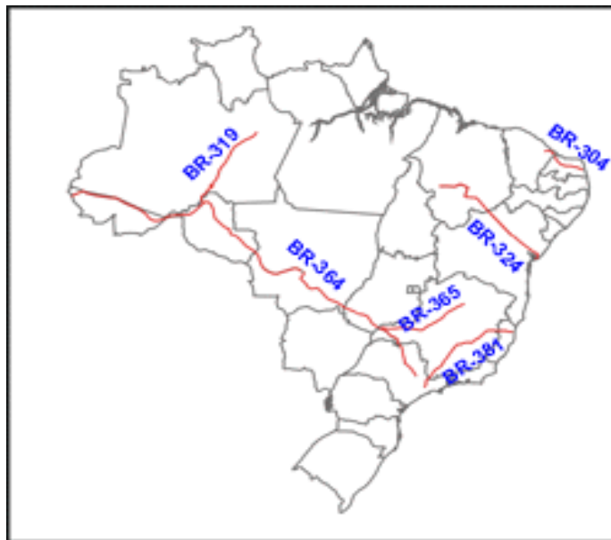
Figura 4 - Rodovias Diagonais