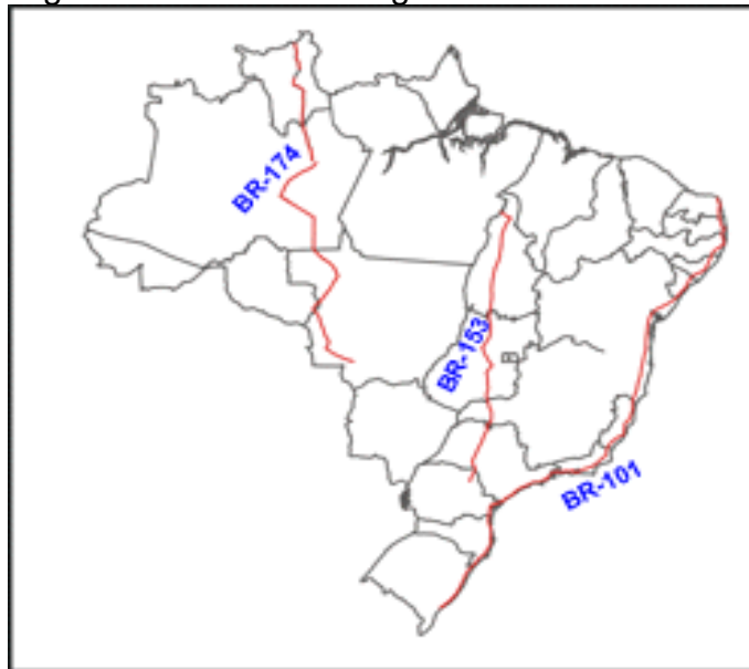
Figura 2 - Rodovias Longitudinais