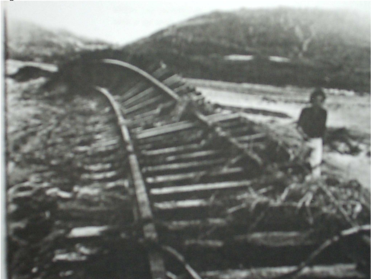
Figura 8 - Trilhos destruídos na enchente de 1974