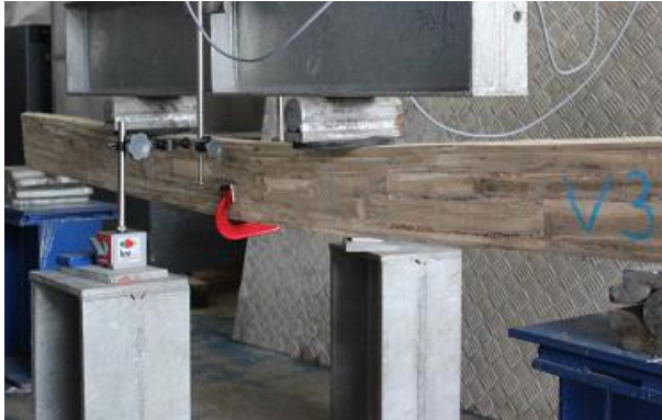
a) Ruptura da viga 3