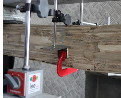
b) Detalhe ruptura da viga 3