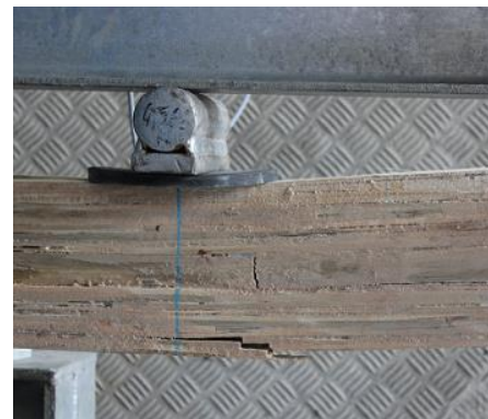
b) Detalhe ruptura da viga 1