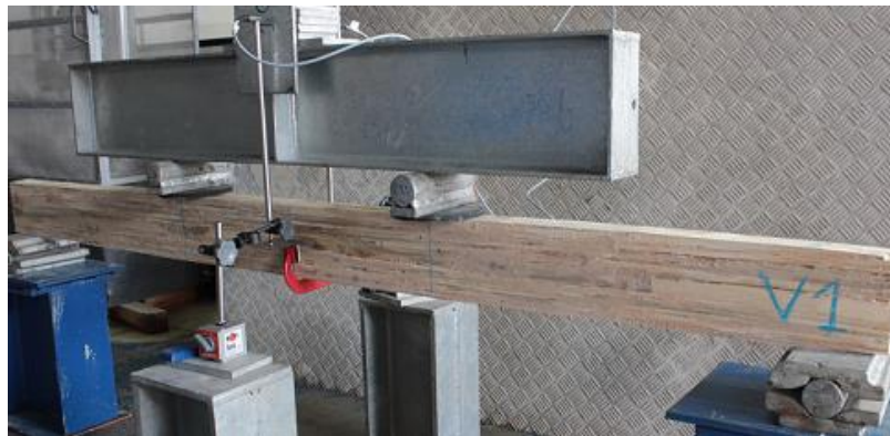
Figura 2 - Detalhes do ensaio das vigas

Por meio de uma viga metálica rígida com perfil I, o carregamento foi distribuído para a viga nos terços médios do vão. Na Figura 2, exibe-se uma das vigas de BLC preparada para o ensaio.