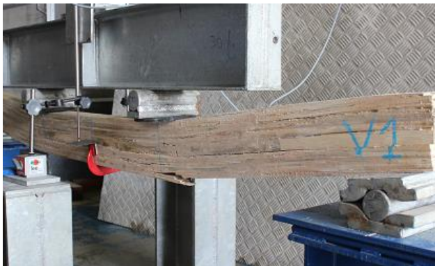
a) Ruptura da viga 1