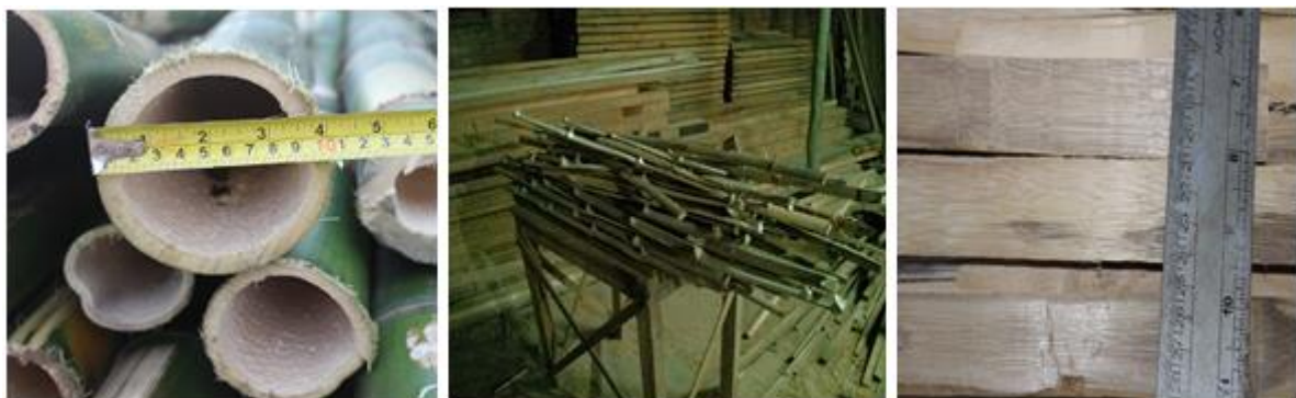
a) Bambu verde