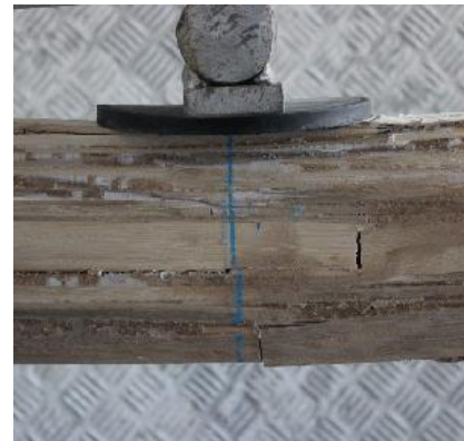
b) Detalhe ruptura da viga 2