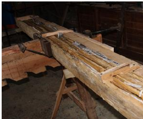
Figura 2 – Processo de colagem

As seções transversais se mantêm dentro do mínimo exigido pelo item 10.2.1 da NBR 7190/1997, que é de 5 cm de espessura e área mínima de 50 cm 2 , apresentando 5 cm de base por 10,4 cm de altura e 200 cm de comprimento. A metodologia inicial adotada foi a mesma utilizada para a elaboração da Madeira Laminada Colada (MLC), de acordo com CARRASCO et al. (1995).