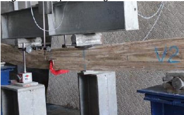
a) Ruptura da viga 2