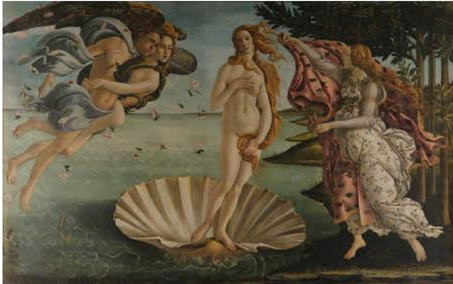
Figura 2 - Nascimento da Vênus, Sandro Botticelli.