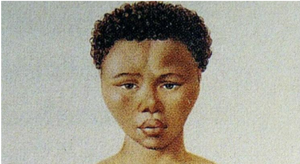
Figura 4 - Saartjie Baartman.