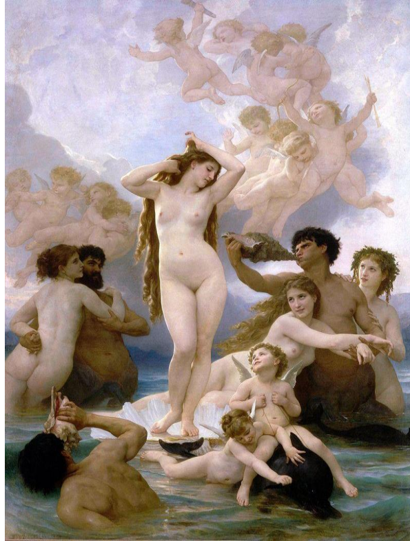
Figura 3 - A Vênus de Bouguereau

atuou para definir raças e gêneros e o lugar de cada um.