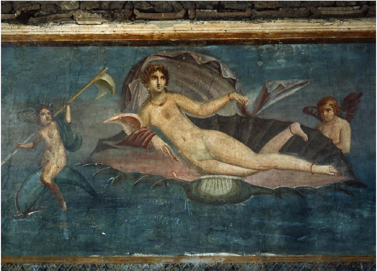
Figura 1- Vênus na Concha, Pintura localizada em Pompeia, Fonte: (Sanfelice 2012, p.07)

exemplo para o projeto de humanidade que estava sendo construído na Europa da Idade Moderna e que teria seu desabrochar na Idade Contemporânea, mais precisamente no século XIX, que discutirei ao longo desse trabalho.