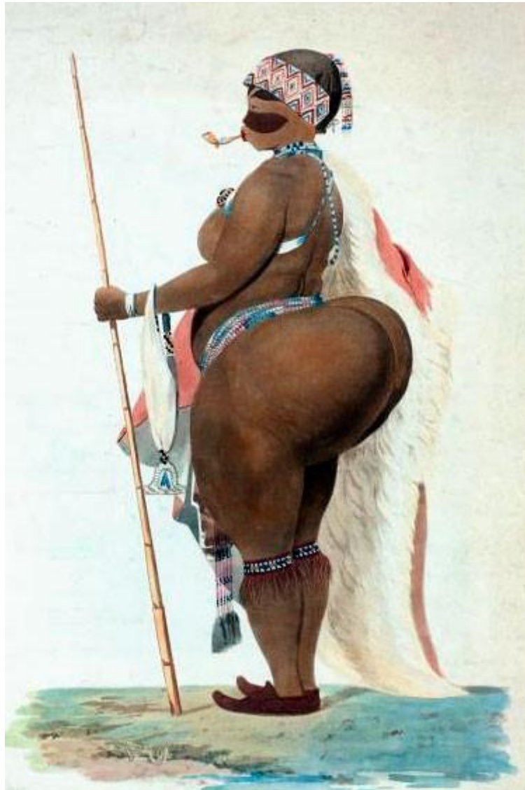
Figura 6 - Saartjie Baartman, la Venus hottentote – Afrique du Sud 1789, Paris 1815.

Fonte: Disponível em: < https://br.pinterest.com/pin/350858627205240357/ > Acesso em 28 de novembro de 2017.