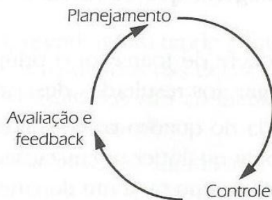
Figura 1: Natureza cíclica do processo da administração.

Conforme Montana e Charnov (2000), as atividades de uma organização deveriam ser direcionadas através de um ciclo por um determinado tempo. O ciclo na figura 1 representa a natureza cíclica do processo.