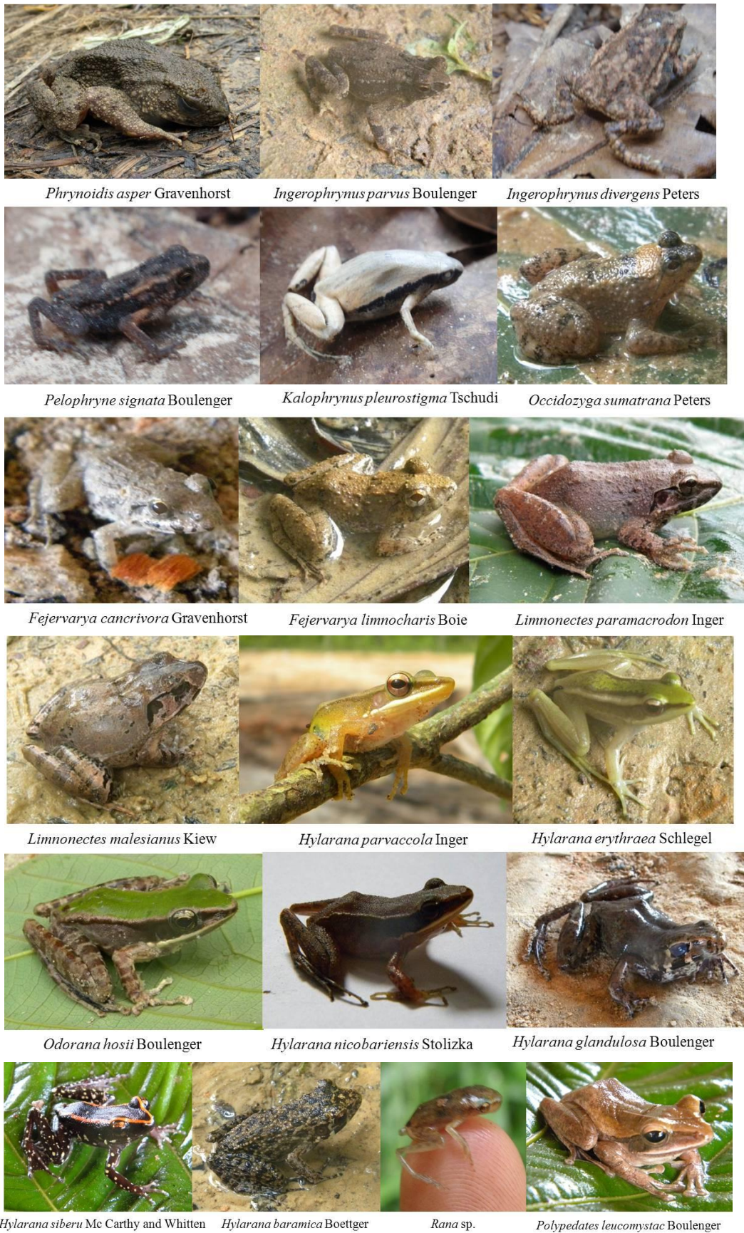
Gambar 3. Jenis-jenis Anura yang ditemukan di Hutan Harapan, Jambi.