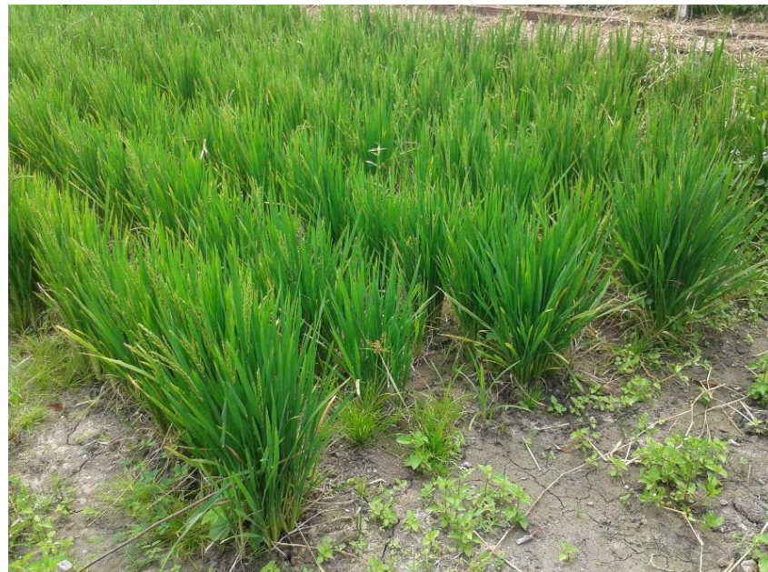
Figura 2. Tratamento com a maior eficácia no controle das plantas daninhas na cultura do arroz-vermelho em função de diferentes doses de herbicidas de forma isolada e associada. Areia - PB, CCA – UFPB, 2016