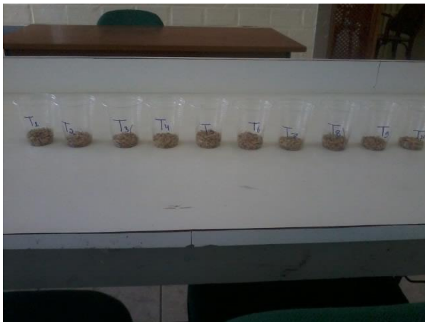
Figura 4. Sementes da cultura do arroz-vermelho destinada a cada tratamento. Areia - PB, CCA – UFPB, 2016.