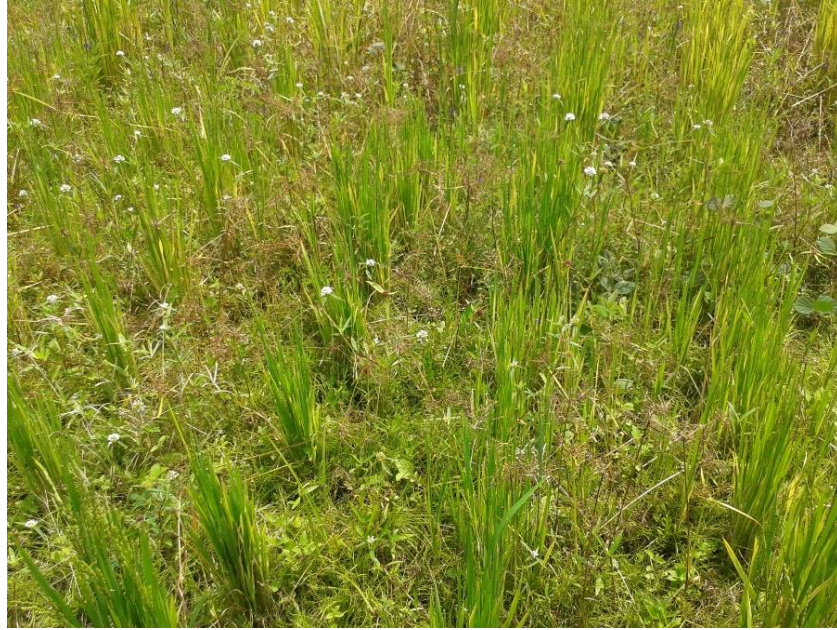
Figura 1. Testemunha do experimento da cultura do arroz-vermelho em função de diferentes doses de herbicidas de forma isolada e associada. Areia - PB, CCA – UFPB, 2016.