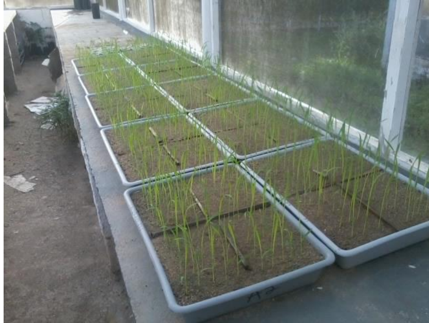
Figura 3. Emergência em leito de areia de sementes da cultura do arroz-vermelho em função de diferentes doses de herbicidas de forma isolada e associada. Areia - PB, CCA – UFPB, 2016.