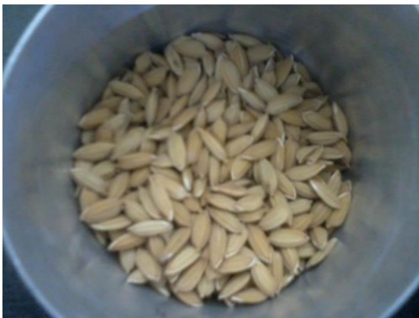
Figura 6. Sementes da cultura do arroz-vermelho puras. Areia - PB, CCA – UFPB, 2016.