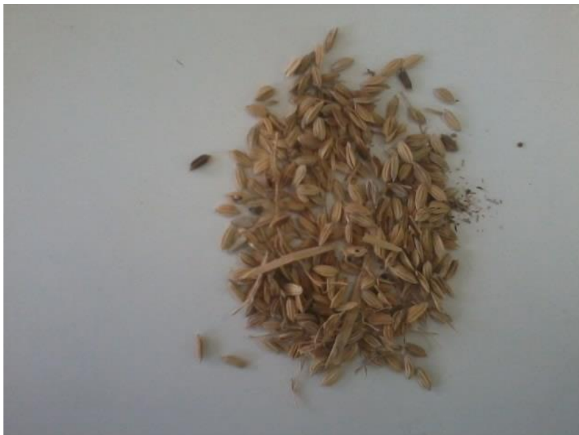
Figura 5. Sementes da cultura do arroz-vermelho com impurezas. Areia - PB, CCA – UFPB, 2016.