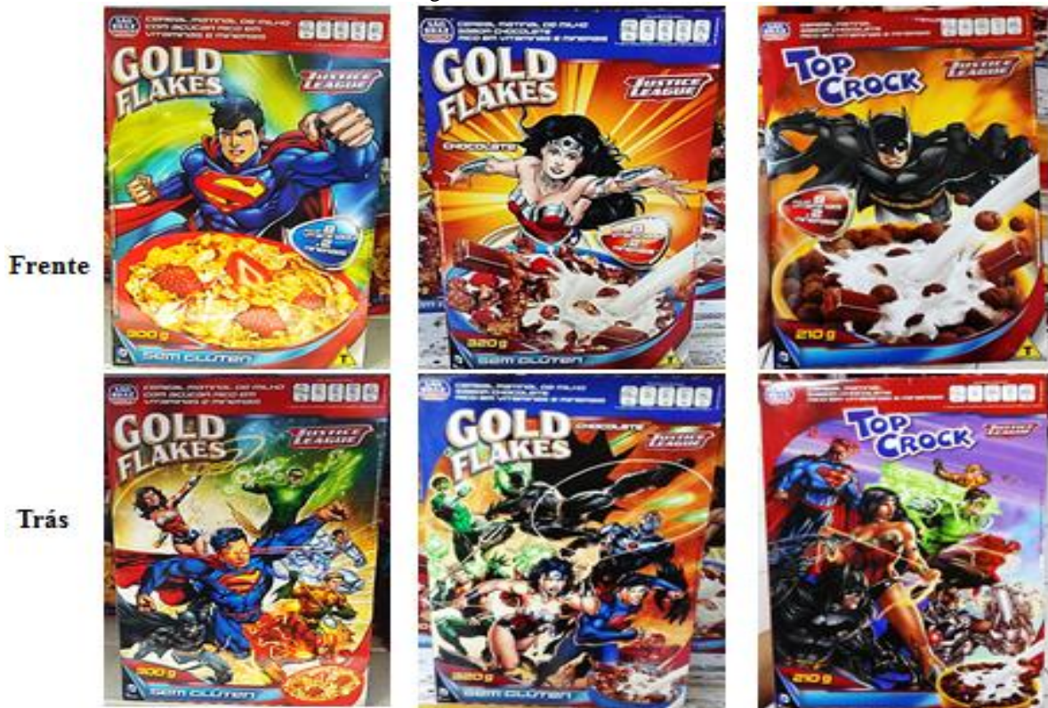
Figura 3 – Cereais São Braz