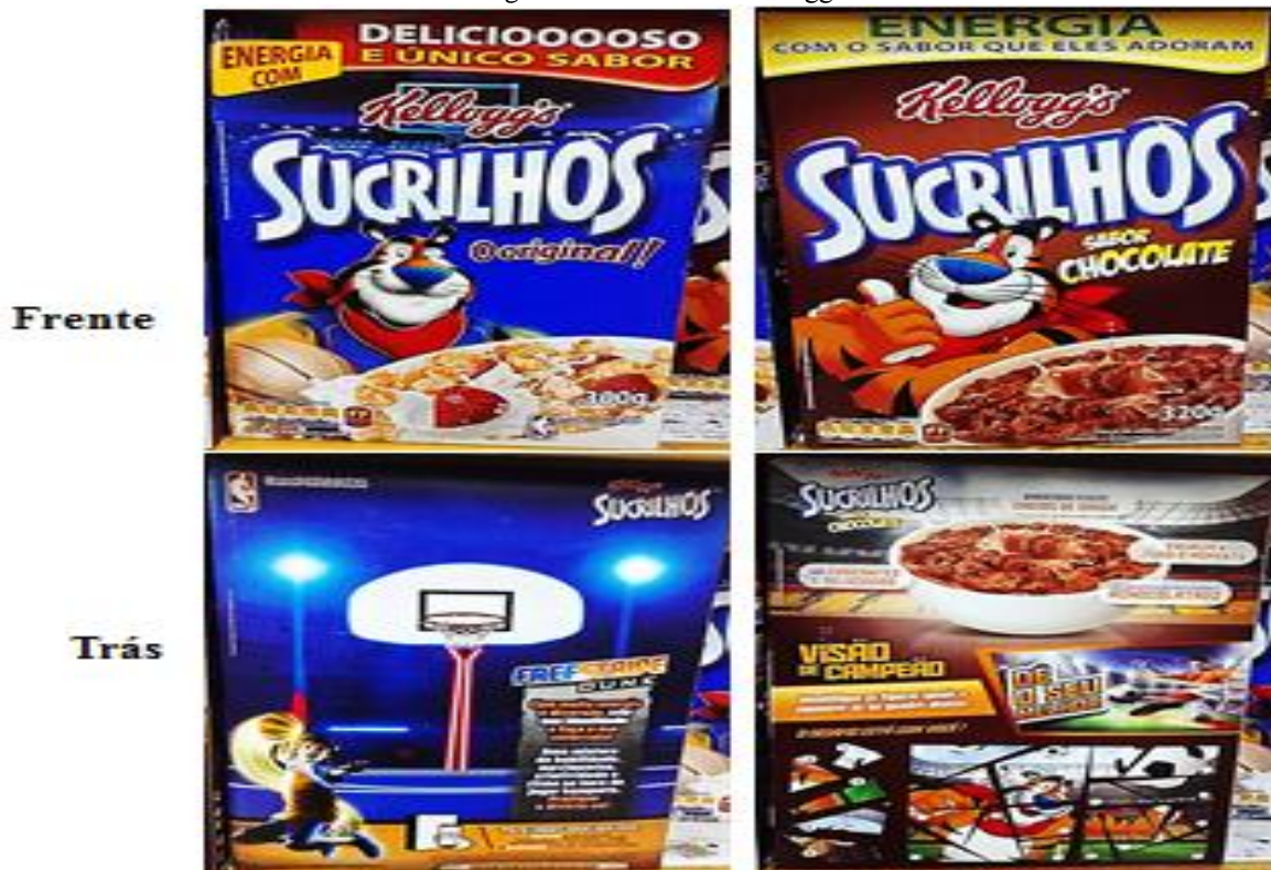
Figura 4 – Cereais da Kellogg's