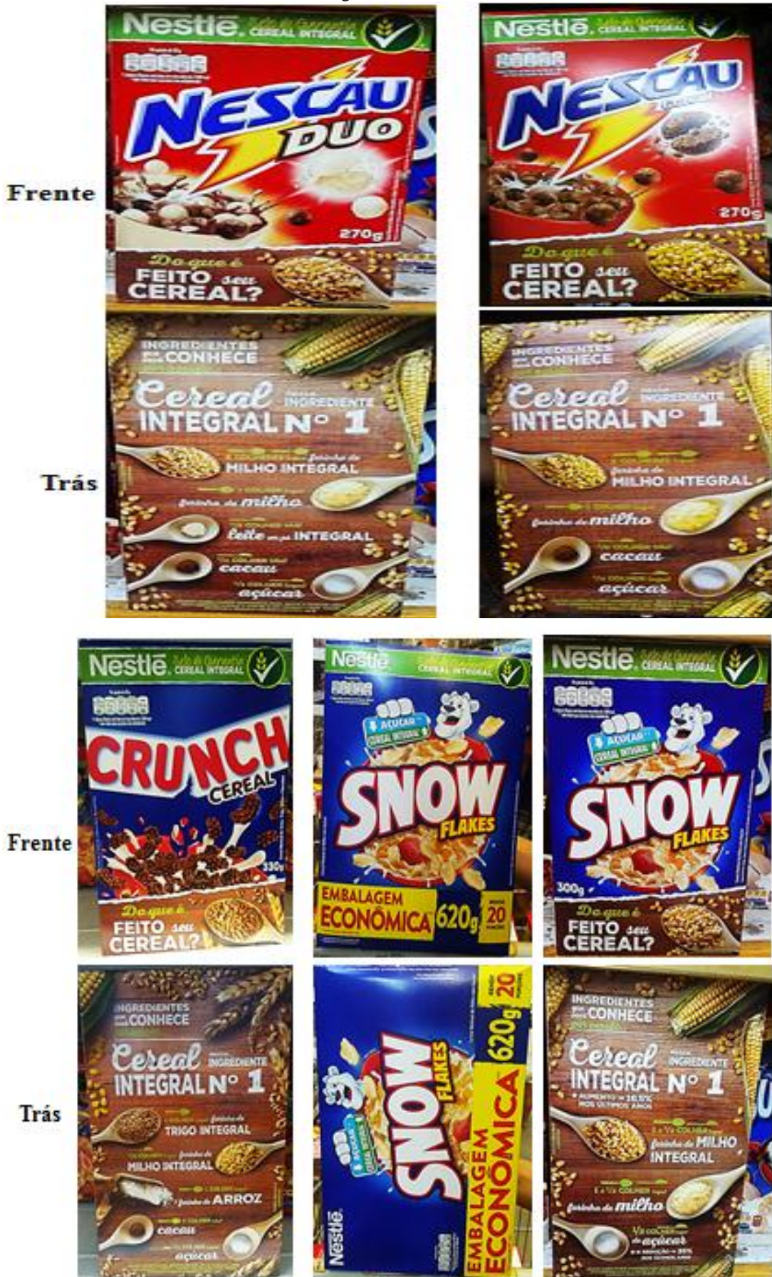
Figura 5 – Cereais da Nestlé