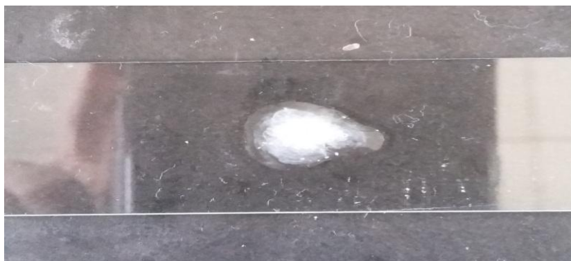
Gambar 3. Hasil uji katalase