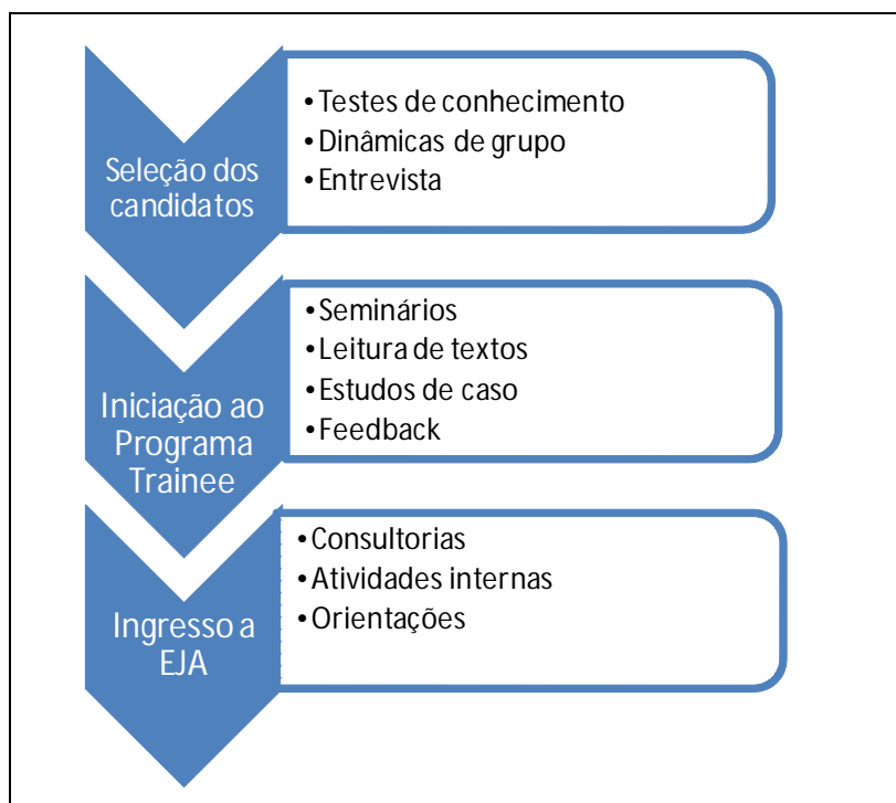
Figura 3 – Etapas do processo de aprendizagem

Os enfoques apresentados anteriormente mostram o sentimento dos ex-trainees quanto a dimensão de como ocorre o processo da aprendizagem adquirida no programa. A figura 02 mostra resumidamente as etapas e as variáveis do aprendizado associadas a cada etapa do programa.