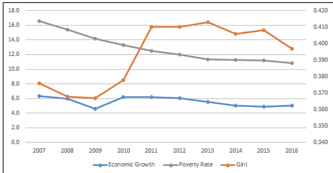
Gambar 3. Pertumbuhan Ekonomi, Tingkat Kemiskinan dan Ketimpangan di Indonesia tahun 2007-2016

Potensi pertumbuhan ekonomi pada suatu negara sangat dipengaruhi oleh sumber daya yang dimilikinya, baik human capital , physical capital , maupun resource endowment . Harbison (1973) menyebutkan bahwa sumber daya manusia merupakan modal dasar dari kekayaan suatu bangsa. modal fisik dan sumber daya alam hanyalah faktor produksi yang pada dasarnya bersifat pasif, manusialah yang bersifat aktif; manusialah yang merupakan agen aktif yang akan mengumpulkan modal, mengeksploitasi sumber-sumber daya alam, membangun berbagai macam organisasi sosial, ekonomi dan politik, serta melaksanakan pembangunan nasional.