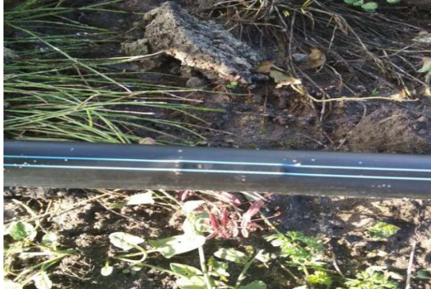
Фото 3. Крапельна стрічка «Ro-Drip» в роботі

Крапельна стрічка «Ro-Drip» забезпечує найбільше надійне і ефективне вирішення будь-яких зрошувальних задач при підземному і поверхневому зрошенні навіть при довжині стрічки, яка перевищує 400 метрів. Стрічка «Ro-Drip» – є єдиною крапельною стрічкою, спеціально розробленою для забезпечення рівномірного потоку і дозволяє вирішити одну із самих складних проблем в експлуатації – засмічення в умовах сильного забруднення.