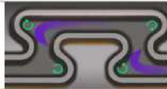
Фото 5. Система Vortex Flow Action

• Турбулентний потік (Vortex Flow Action) — протидіє засміченню системи шляхом призупинення руху рідини (фото 5). Турбулентний рух рідини в системі крапельного зрошення призупиняє частки бруду, сприяє подоланню кутів, викривлень і поворотів каналу. У результаті тверді частки безперервно вимиваються потоком води й не можуть закупорити канал.