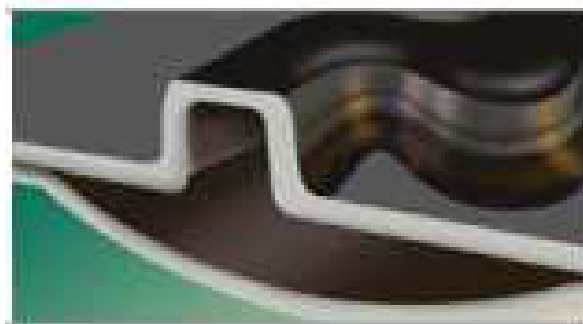
Фото 6. Додатковий захисний канал

• Промивний канал, що розширюється (фото 6). За екстремальних умов фільтрації води або відсутності фільтрації використовують унікальну технологію каналу, що розширюється (Expanding Flow Channel).