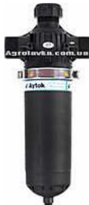
Фото 3. Дисковий фільтр для фільтрації води в системі крапельного поливу

В нашому випадку було підібрано дисковий фільтр. Конструкція дискового фільтра призначена для більш глибокого фільтрування. Складається з корпусу і фільтруючого елемента у вигляді набору щільно стиснутих тонких дисків з радіальними канавками. Вони поєднують надійність і найменшу собівартість обслуговування. Використовуються для видалення неорганічних і органічних частинок. Зазвичай використовуються при заборі води з свердловин. При засміченні можуть промиватися зворотним потоком води. Ступінь фільтрації 20-50-100-125 \mu\text{m} , площа фільтрації – 1805 \text{cm}^2 , максимальний робочий тиск — 8 bar, максимальна пропускна здатність: 50 \text{m}^3/\text{год} .