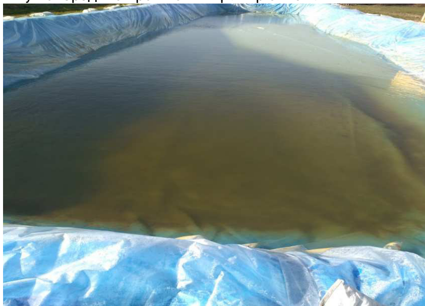
Фото 2. Басейн-відстійник

Джерелом водопостачання є свердловина з якої здійснюється забір води. Свердловина була пробурена ТОВ «ГЕОЛОГ ЛТГ» глибиною 95,0 м, робочим діаметром 93 мм і дебітом 5,4 м 3 /год, а також закріплена обсадними трубами. Експлуатаційними показниками свердловини є статистичний тиск, що становить 5,0 м, динамічний – 16,0 м при дебіті 5,4 м 3 /год. Відповідно до експлуатаційних рекомендацій було встановлено насос потужністю 6,0 м 3 /год. Глибину установки насоса можна змінювати у залежності від обсягу водоподачі, але не нижче 22,0 м [3]. Виходячи із рекомендацій було використано чотирьохтактну бензинову мотопомпу ТМ «Könner&Söhnen» з діаметром вхідної труби 80 мм. Вода яка забиралася із свердловини подавалася до заспокійливого басейну, який має розміри 60х20 м. Вода надійшовши до басейну відстоювалася та нагрівалася, а потім за допомогою аналогічної мотопомпи подавалася до системи крапельного поливу попередньо пройшовши фільтр очистки.