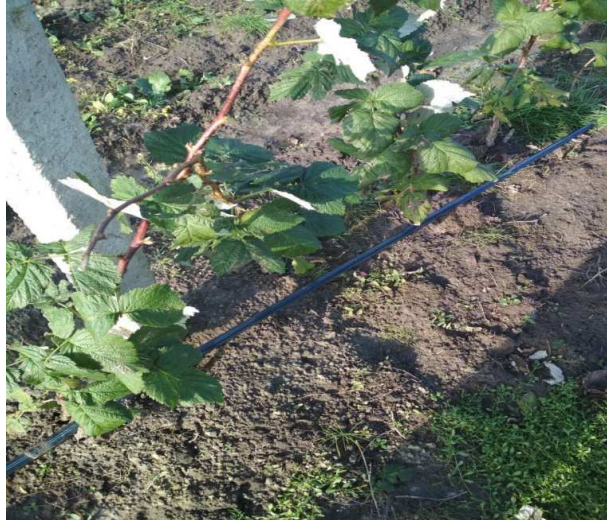
Фото 1. Малина сорту «Glen Ample» при крапельному поливі

на в чотирьох секторах. Система крапельного поливу, що застосована для поливу малини складається з магістрального трубопроводу діаметром 110 мм та розподільчого трубопроводів діаметром 75 мм, а також із крапельної стрічки «Ro-Drip».