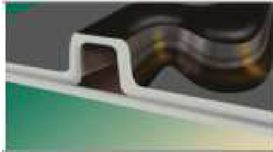
Фото 4. Прецизійна форма каналу

• Турбулентний потік (Vortex Flow Action) — протидіє засміченню системи шляхом призупинення руху рідини (фото 5). Турбулентний рух рідини в системі крапельного зрошення призупиняє частки бруду, сприяє подоланню кутів, викривлень і поворотів каналу. У результаті тверді частки безперервно вимиваються потоком води й не можуть закупорити канал.