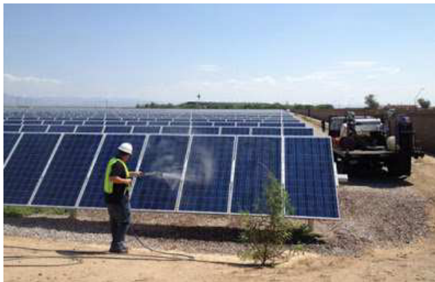
Рис. 4. Мийка сонячних панелей

Під час експлуатації сонячних електростанцій з'являється ще одна доволі значна проблема, це осідання на сонячних панелях часток пилу, піску, а також забруднення пташиним послідом і, як наслідок, зменшення продуктивності на 15-20% [1]. Для того, щоб очистити панелі від наносів необхідно під час проектування сонячних електростанцій передбачати можливість періодичного їх миття (рис. 4).