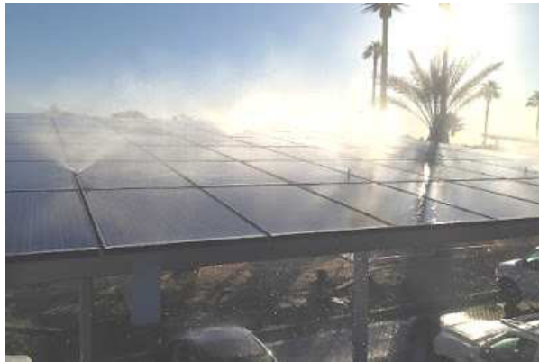
Рис. 5. Система автоматичної мийки панелей

часто густо, дебіту існуючих свердловин не вистачає для повноцінного догляду за сонячними модулями.