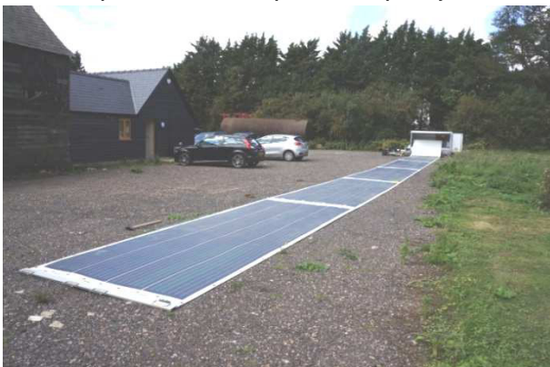
Рис. 8. Гнучкий фотоелектричний модуль

Таке рішення з розміщення енергомодулів дозволяє зекономити дефіцитні сільськогосподарські площі, однак, на нашу думку, виникають великі питання щодо можливості проведення ремонтних і експлуатаційних операцій під час роботи зрошувального каналу.