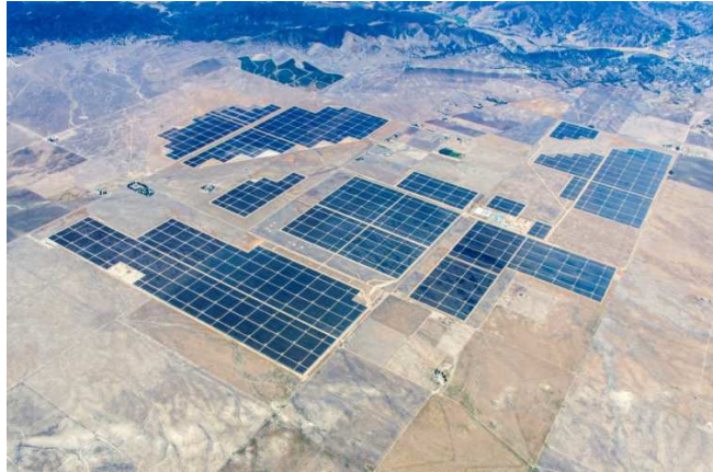
Рис. 3. Сонячна електростанція Toraz Solar Farm, знімок з супутника

Під час експлуатації сонячних електростанцій з'являється ще одна доволі значна проблема, це осідання на сонячних панелях часток пилу, піску, а також забруднення пташиним послідом і, як наслідок, зменшення продуктивності на 15-20% [1]. Для того, щоб очистити панелі від наносів необхідно під час проектування сонячних електростанцій передбачати можливість періодичного їх миття (рис. 4).