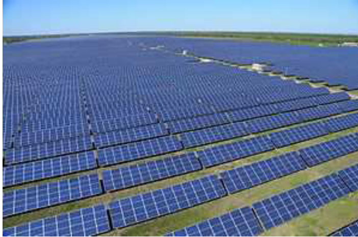
Рис. 1. Сонячна електростанція Старокозача, Одеська область