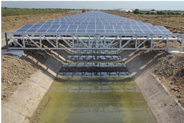
Рис. 7. Розташування сонячних батарей над зрошувальним каналом

Варто відмітити, що думку використати відкрити канали для розміщення елементів сонячної електростанції першими втілили в життя в Індії в рамках проекту Solar canals [2]. В цьому випадку на 15-метрових металевих конструкціях над зрошувальним каналом були розташовані сонячні панелі (рис. 7).