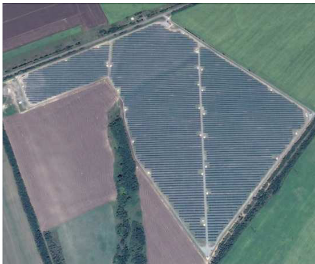
Рис. 2. Сонячна електростанція Вознесенськ

А одна з найбільших сонячних електростанцій світу Topaz Solar Farm в Каліфорнії, США, потужністю 550 МВт зайняла площу 5500 га і потужності мають ще нарощуватися (рис. 3).