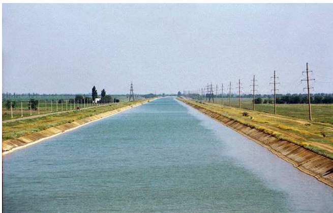
Рис. 6. Ділянка Каховського магістрального каналу

З метою зменшення впливу наведених негативних факторів на впровадження використання сонячної енергетики в народному господарстві України, авторами пропонується використати для розміщення сонячних енергетичних модулів інфраструктуру існуючих зрошувальних систем. Зрошувальні системи півдня країни (найбільш сприятливого регіону для розміщення сонячних електростанцій) складає біля 1,4 млн га. Головними елементами великих зрошувальних систем, таких як Каховська, Красно-знам'янська, Інгулецька тощо є магістральні та розподільчі відкриті канали (рис. 6). Характерна особливість відкритих зрошувальних каналів – це наявність бокових бERM шириною 3-5 м, призначених для експлуатаційних робіт. Варто відмітити, що сумарна довжина магістральних та розподільчих каналів досягає 1400 км.