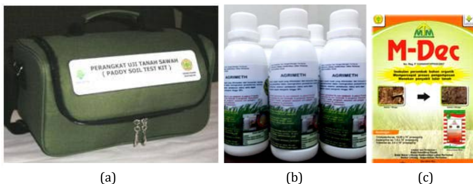
Gambar 2. Produk yang digunakan dalam aplikasi teknologi Jarwo Super (a) Test Kit PUTS, (b) Pupuk Hayati Agrimeth, dan (c) Dekomposer M-Dec

Menurut Petunjuk Teknis Balitbangtan (2016) Teknologi Jarwo Super telah diuji coba pada 50 ha lahan di Kabupaten Indramayu. Varietas yang ditanam adalah Inpari-30 Ciharang Sub-1, Inpari 32 HDB dan Inpari 33 memberikan hasil diatas 10 ton GKG ha -1 dibandingkan dengan Varietas Ciharang di lahan petani diluar demarea hanya menghasilkan 6 ton GKG ha -1 . Paket teknologi yang dicobakan selain teknik tanam jajar legowo 2:1 dan varietas hasil tinggi adalah pemupukan urea 200 kg ha -1 dan NPK Phonska 300 kg ha -1 dikombinasikan dengan 2 t ha -1 kompos (pupuk kandang atau jerami), penggunaan dekomposer M-Dec sebanyak 1 kg ton -1 jerami. Paket ini dilengkapi dengan seed treatment dengan pupuk hayati Agrimeth dosis 400 g 25kg -1 benih. Untuk pengendalian OPT dilakukan dengan aplikasi BioProtector dengan dosis 6-10 botol per hektar, untuk tanaman muda 5 cc l -1 yang diberikan