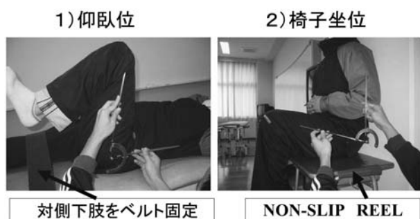
図1. 股関節自動屈曲角度の測定

右股関節自動屈曲角度を仰臥位と椅子坐位にて測定した。椅子坐位では、股関節屈曲運動時の坐骨の前方へのずれを防止するため座面に Dycem (r) Non-Slip Reels を使用した。壁を背にして椅子坐位をとらせ、ランバーサポートによって腰椎の後弯をブロックした (図1)。