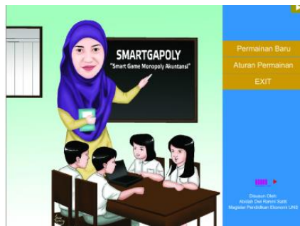
Gambar 1. Tampilan Awal Media Interaktif Smartgopoly