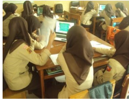
Gambar 3. Siswa Antusias Mengikuti Kegiatan Tournament

Tahapan terakhir pada pembelajaran TGT ini adalah pemberian penghargaan kelompok. Hasil observasi menunjukkan bahwa iming-iming penghargaan inilah yang membuat siswa memberikan kemampuan terbaiknya. Hal ini didukung dengan beberapa penelitian yang telah dilakukan Slavin (2011) yang menyimpulkan bahwa penghargaan kelompok sangat penting untuk meningkatkan prestasi kemampuan dasar. Jika siswa diberi penghargaan, mereka akan termotivasi untuk meraih sukses dengan melakukan lebih baik dari apa yang mereka lakukan sebelumnya. Dengan demikian, 5 tahapan MPK-TGT Smartgapoly mampu mengakomodasi kebutuhan belajar siswa, sehingga MPK-TGT Smartgapoly menghasilkan prestasi belajar akuntansi yang lebih baik daripada MPL.