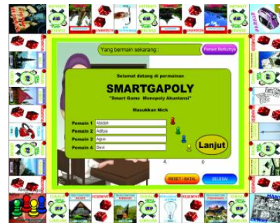
Gambar 2. Salah Satu Tampilan Game Smartgopoly