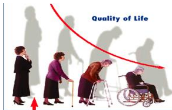
Gambar 4. Penurunan kualitas hidup wanita dengan osteoporosis.