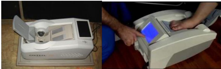
Gambar 3. Instrumen dan Penggunaan Heel QUS.

Tes Heel QUS dilakukan dengan individu duduk, lepaskan alas kaki dan kaos kaki yang di kenakan, pastikan telapak kaki dalam keadaan bersih dan tidak ada kotoran yang menempel, kemudian satu kaki ditempatkan pada posisi kaki instrumen QUS. Tidak ada ketentuan kaki kiri atau kanan.