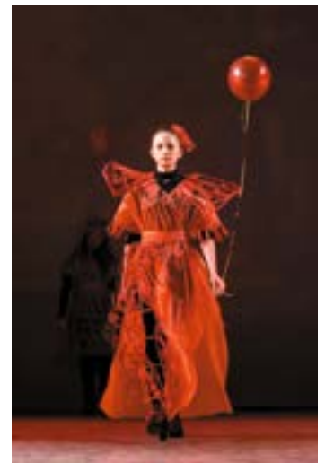
^ «Красный» показ «Тайны цвета», 2017