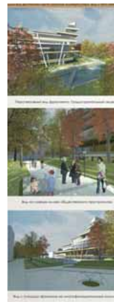
^ Städtebauliche Details (Leonova Alina) / Градостроительные фрагменты (Алина Леонова)

Градостроительное развитие Альбертштадта еще не завершено. По сей день остаются неиспользованными территории расположения военных баз, когда-то имевших важное стратегическое значение. Преобразование этой зоны для гражданского использования дает массу возможностей, одновременно создавая особые сложности.