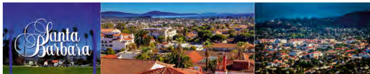
< Рис. 7. На благоухающих холмах Санта-Барбары все виллы напоминают funeral homes. Ж. Бодрийяр Санта-Барбара, Калифорния, США