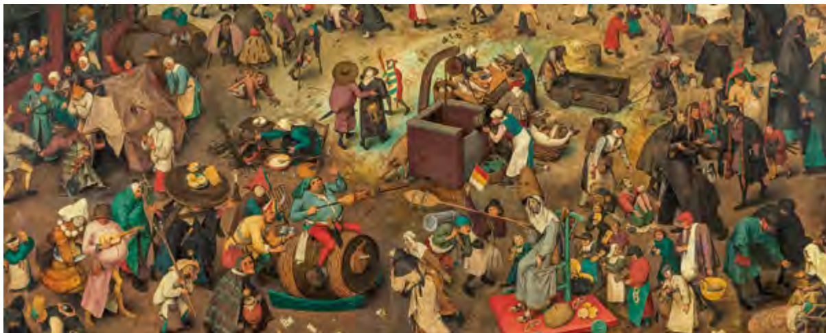
< Рис. 2. Города – извечные плацдармы борьбы норм и их нарушений, порядка и хаоса, карантина и карнавала, дисциплины и свободы. Питер Брейгель Старший. Битва Масленицы и Поста, 1559 г. Фрагмент