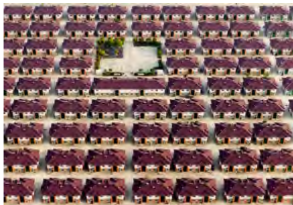
< Рис. 5. Нас лишают всякой инаковости, всякой необычности и обрекают на воспроизводство Того же самого в бесконечном процессе отождествления, в универсальной культуре тождественности. Ж. Бодрийяр. Застройка в провинции Цзянсу, Китай

Поэтому осмысленной стратегией действия с городами и средой сегодня, особенно в России, является вовсе не достижение целей, представляющихся очевидными, вроде «оздоровления», «повышения комфортности», роста/понижения плотности и пр. Имеющиеся технологии достижения всего этого не приносят социального блага, не дают удовлетворения, не защищают от втягивания в грязные манипуляции с общественным мнением и в банальное разворовывание ресурсов всех видов, включая лимит человеческого доверия. Осмысленна постановка всего известного «в скобки», постановка вопросов о происхождении наших убежденностей и ориентиров. Не стройка, но размышление; не синтез и симбиоз всего со всем, но анализ и постижение синкретических феноменов; не разбрасывание, но собирание камней. И уж точно не форсированная инноватика, демон которой все еще застит глаза администрациям, долж-