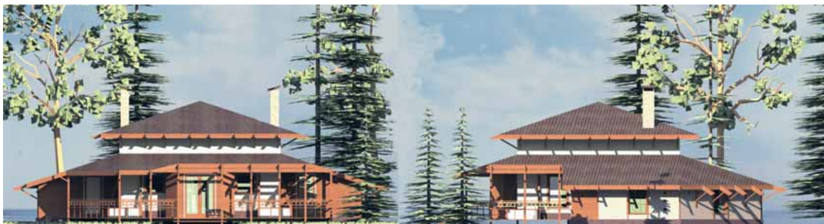
^ v Проект экспериментального соломенного дома на территории учебного центра «Крона» в Бобровке.