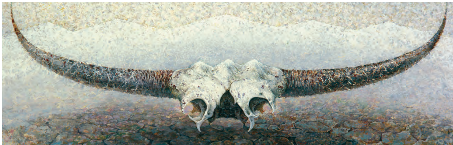
^ Тунка, 2002 г.

Река Иркут для жителей Бурятии и Иркутской области имеет особое значение. Зародившись высоко в Саянах, Иркут собирает воду из бесчисленных рек и ручьев Восточных Саян, южных отрогов Хамар-Дабана, Олхинского плато, и отдает их Ангаре прямо в центре Иркутска. В картине «Иркут» художник Максимов сумел передать гамму чувств человека, для которого Иркут является рекой детства с майскими одуванчиками по берегам, бумажными корабликами, деловитыми курами и неспешным вечерним общением соседей на завалинках деревянных домов.