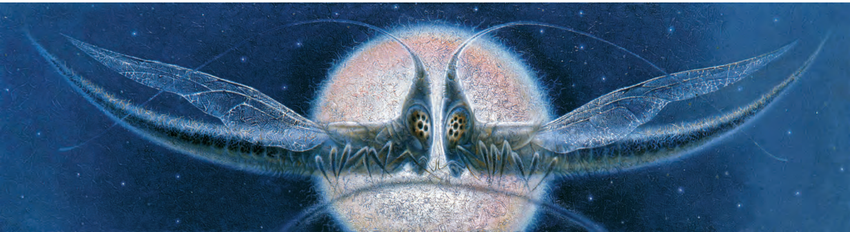
^ Влюбленность, 2002 г.