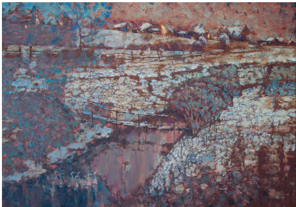
^ Сумерки, 2013 г.