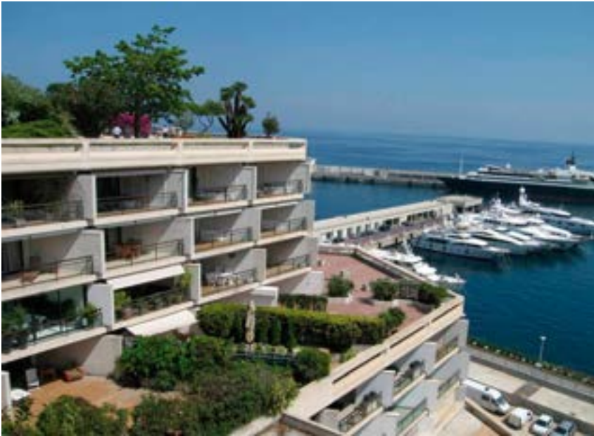
^ Крыши в центре Милана и Монте-Карло