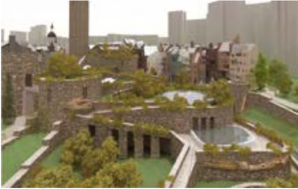
^ МФК «Старый город» в Химках