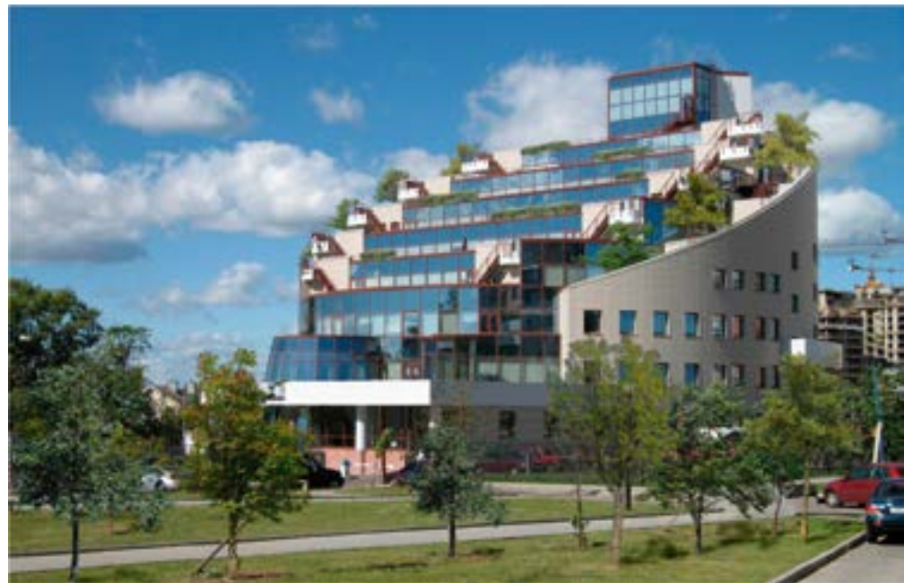
v АДЦ на проспекте Маршала Жукова

Немаловажно, что при определенных размерах участка и количестве растений разных видов образуется устойчивая, самоподдерживающаяся система – биоциноз, дающая жизнь (кров и пищу) множеству живых организмов: животным, птицам, насекомым. Система эта способна «процветать» даже в самом центре гигантского мегаполиса.