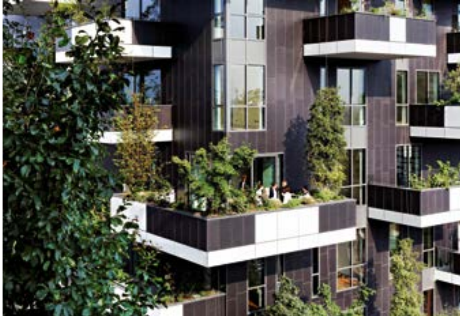
^ v «Вертикальный лес», общий вид и разрез по балконам