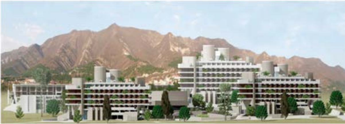
< v Пансионат «Сосновая Роща» в Геленджике. Проект реставрации и достройки