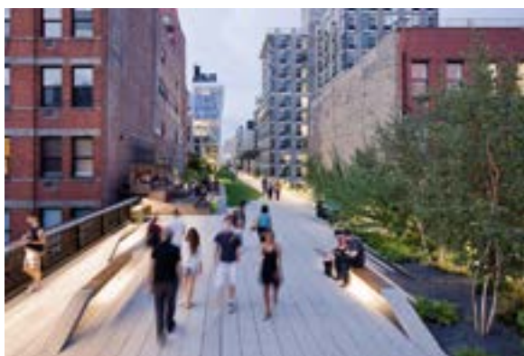
v Конкурсный проект М. Хазанова High-Line, Нью-Йорк

Успех этой затеи вызвал целую серию подобных проектов по всему миру, породив новую широко обсуждаемую фантастическую концепцию «зеленого моста» через Темзу. Хотя, по сути, ничего принципиально нового в ней нет: в Европе уже существует множество озеленен-