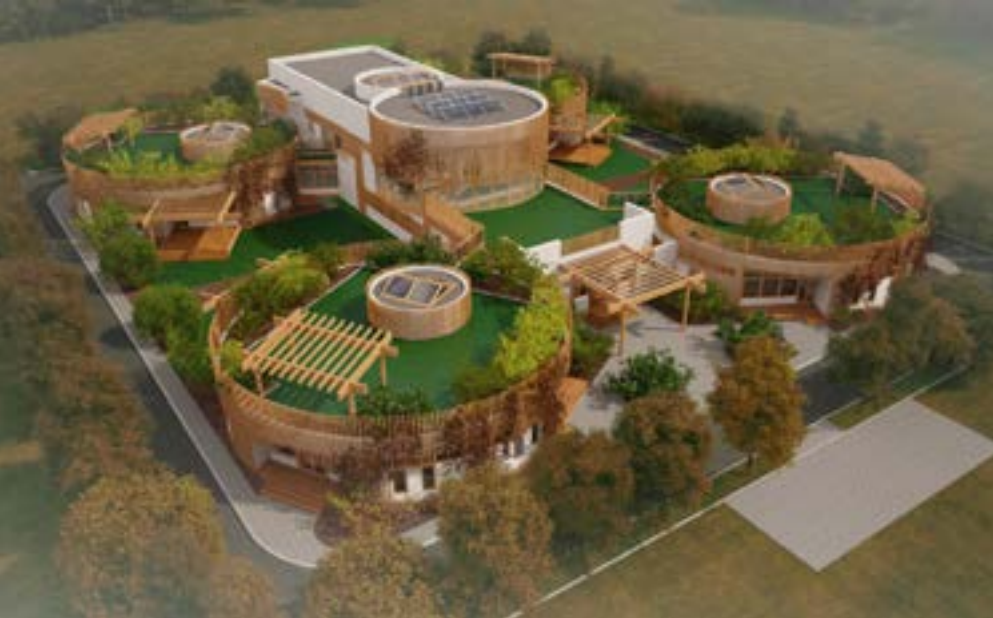
^ Детский сад и павильон яхт-клуба