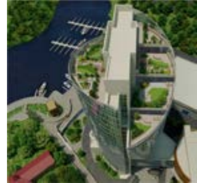
^ v Кантри-Парк-3