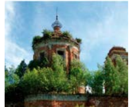
^ Царицыно до реконструкции

европейского средневекового города. Центром этого комплекса должно быть здание Цитадели, с заросшими крышами-террасами, поднимающимися от парковой зоны Кантри-Парка и берега Бутаковского залива Химкинского водохранилища. Эта концепция удостоена Серебряного знака «Зодчества-2012», однако ее реализация приостановлена по известным причинам [9].