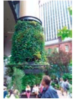
^ Приемы вертикального озеленения

> Библиотека в Техническом университете Дельфта