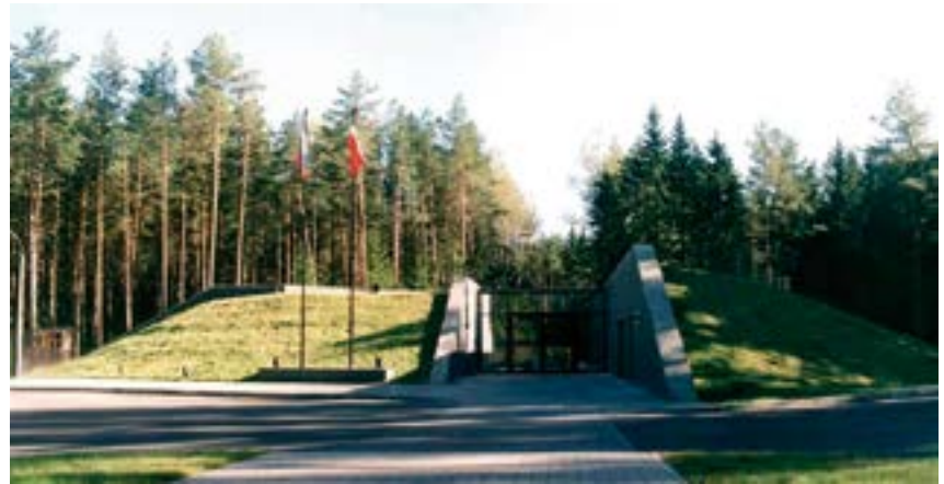
v Мемориальный центр «Катень» и теннисный корт в Кунцево