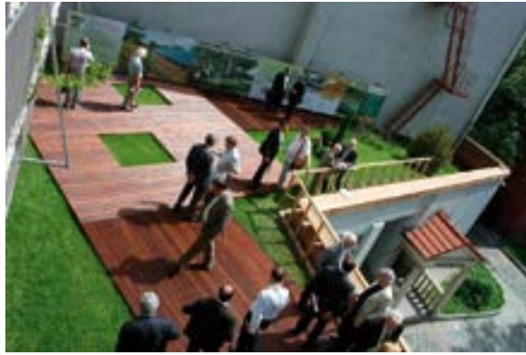
^ Крыша ЦДА