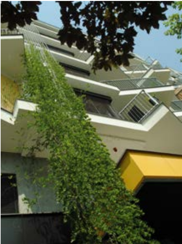
v Приемы вертикального озеленения

Но самый яркий пример – Намба-Парк в Осаке. В центре невообразимо перенаселенного мегаполиса на участке площадью 3,37 га разместили пересадочный узел, гараж, офисы, гостиницу, жилье, магазины, культурный центр и роскошный террасный парк с искусственным каньоном (2,5 га), в котором температура на 10 градусов ниже, чем на соседних участках [12]. Фантастическая плотность – более 72 тыс. кв. м на га. Если разместить все эти функции в традиционных «экономичных» коробочках с проездами и пожарными разрывами между ними, то потребовался бы участок земли раза в три боль-