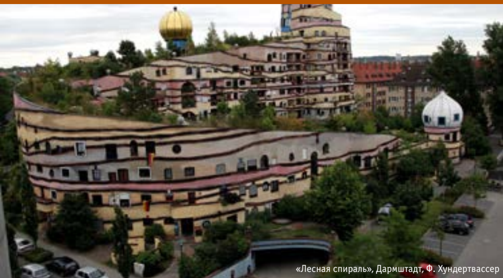
«Лесная спираль», Дармштадт, Ф. Хундертвассер

Анализируются различные подходы к «зеленому строительству» и архитектуре, интегрированной с природой. Дается определение принципа регенерации и обзор истории возникновения, мирового и отечественного опыта развития различных приемов озеленения кровель, фасадов и «висячих садов». Разоблачаются мифы и заблуждения, препятствующие широкому применению озеленения кровель и фасадов в России.