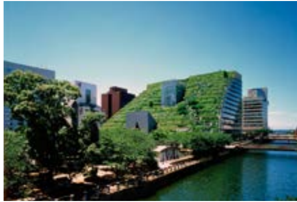
< Приемы вертикального озеленения

В действительности дополнительные затраты нужны не только на посадку растений. Для того чтобы нести нагрузку от растительного слоя необходимы затраты на усиленные конструкции покрытий, но они значительно ниже тех, которые обычно представляют заказчики. Для газона достаточно 6–20 см специального растительного субстрата, который в два раза легче растительного грунта (вес всего ковра не более 150 кг на метр). Для деревьев высотой в 10–15 м необходимо от 65 см до 1 м субстрата, причем не везде, а только вокруг дерева, в виде холма или в подпорных стенках, кадках, ящиках, контейнерах. Пример – уже упомянутый Кантри-Парк в Химках. А в том же Милане ныне модно разводить на