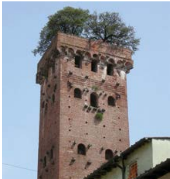
< v Висячие сады в истории