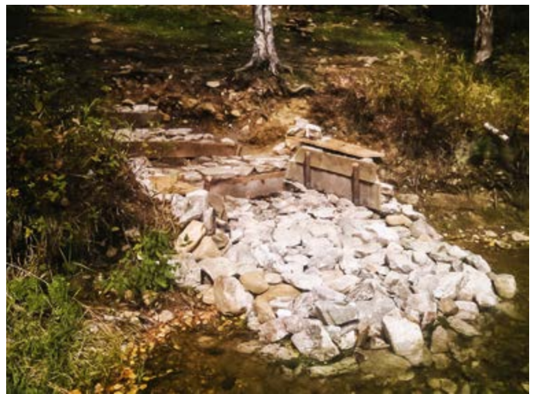
^ Команда Open Land, инсталляция «Место созерцания»