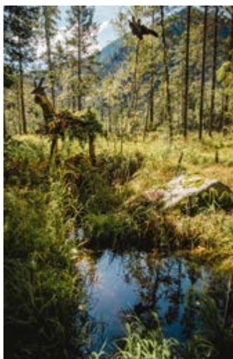
^ Команда Pop-Corn, инсталляция «В сказке»