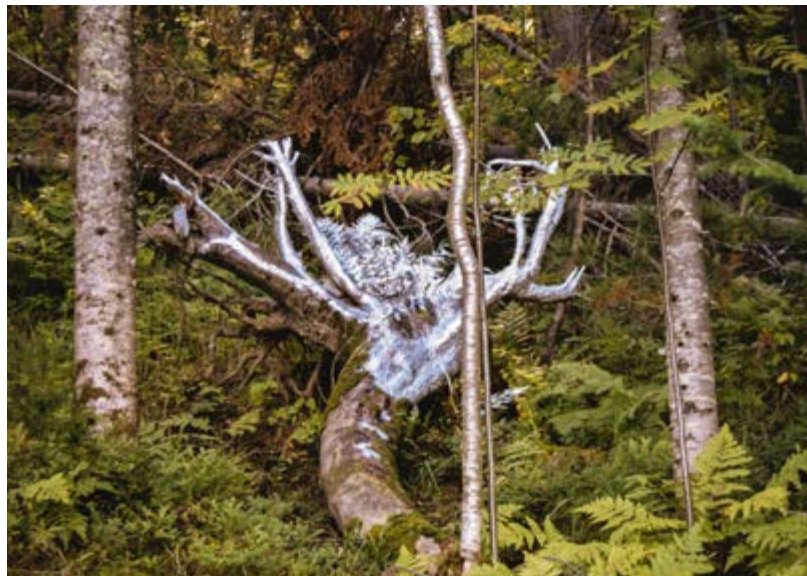
^ Команда «Поющий пенёк», инсталляция «Поющий пенёк-олень»

в махоньких домах-скворечниках на краю леса, заплывали по мерцающей лунной колее в сердце озера, согревались у полыхающих смолистых костров, пели, не отводя глаз от дрожащих путеводных созвездий, и были так счастливы... Словом, в городе такого не пережить.