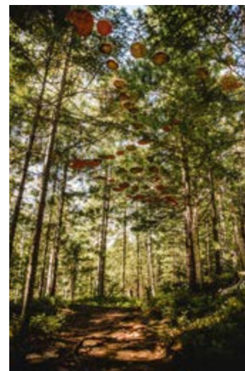
^ Команда PROstore, инсталляция «Воздушная тропа»