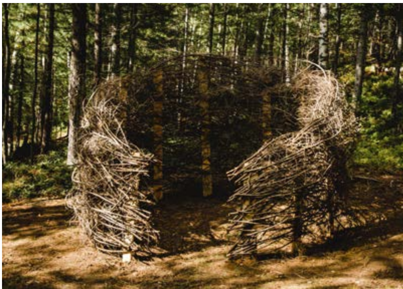
^ Команда Pazzles, инсталляция «Гнездо»