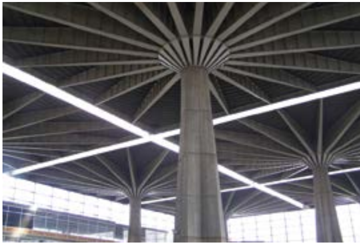
^ Дом Труда в Турине. Архитектор П. Л. Нерви, 1961