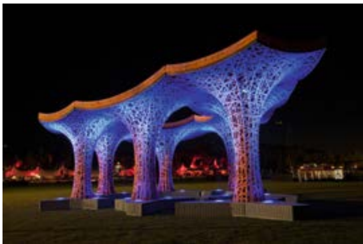
^ Павильон из переработанной бумаги Ball-Nogues Studio