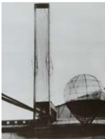
v Институт Ленина. Архитектор И. Леонидов, 1929

Со времен Клода Леду, потрясшего воображение современников фантастическим проектом шарообразного «Дома садовника», архитекторы веками мечтали построить дом в форме шара или эллипсоида. Достаточно близко к осуществлению этой мечты подошли и в России. Это проект института Ленина И. Леонидова.