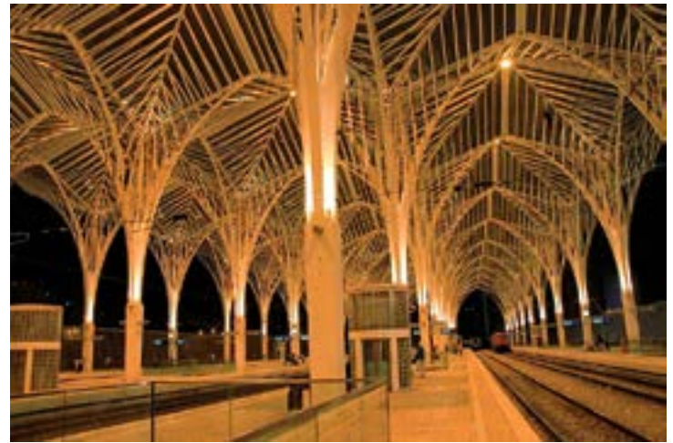
^ Вокзал Ориенте в Лиссабоне. Архитектор С. Калатрава, 1998

Гауди предтечей постмодернизма, возникшего почти через сто лет.