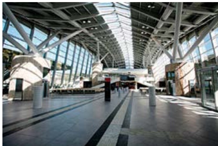
^ Вокзал станции «Олимпийский парк», Сочи. Архитектор Н. Явейн, бюро «Студия 44», 2013

задачи солнцезащиты и использования солнечной энергии [6].