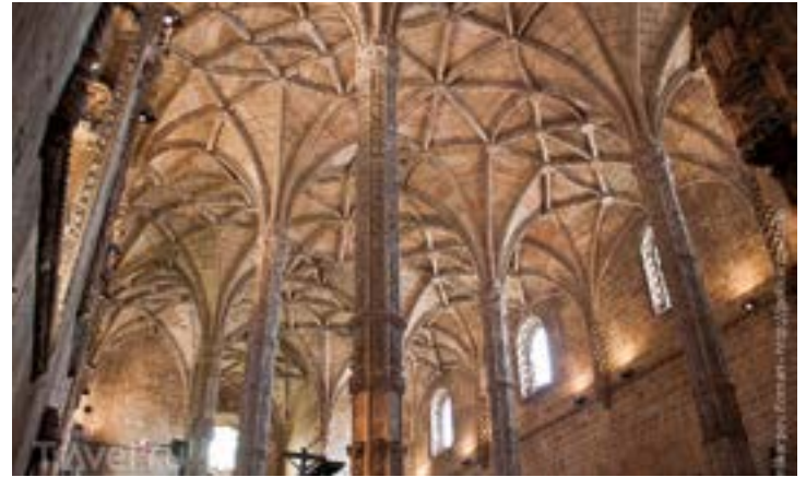
^ Церковь Санта Мария де Белем в Лиссабоне. 1517