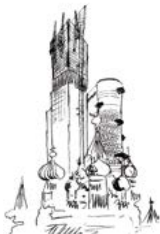
v Эскиз к проекту Наркомтяжмаша. Архитектор И. Леонидов, 1934

стеру Филлеру, но на совершенно иной конструктивной схеме – в концепции геодезического купола. Сначала, в 1959 году, это было еще полушарие: «Золотой купол» для Американской национальной выставки в Москве. Затем оно модифицировалось в почти полный шар диаметром 76 метров павильона США на ЭКСПО–67 в Монреале.