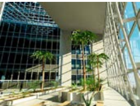
v Коммерцбанк-Тауэр, Франк-фурт-на-Майне. Атриум и разрез. Архитектор Норман Фостер, проект 2001