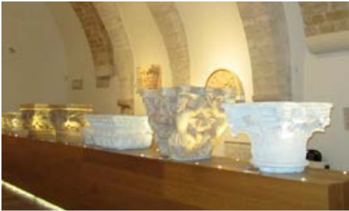
^ Исторический музей г. Бари, Италия