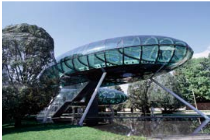
^ Исследовательский центр Grappa Naudini в Бассано-дель-Граппа. Архитектор Массимилиано Фукас, 2006