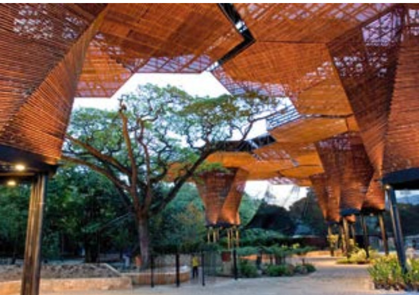
< Ботанический сад Orquideogama в г. Медельин, Колумбия. Архитектор Филипе Меса, 2005

Этот же прием применен в пока не реализованном, но еще более амбициозном проекте Н. Фостера для эко-города будущего на 45–50 тысяч жителей в пустыне ОАЭ вблизи аэропорта Абу-Даби. Здесь «крона» металлических деревьев со встроенными в нее солнечными батареями выполняет одновременно