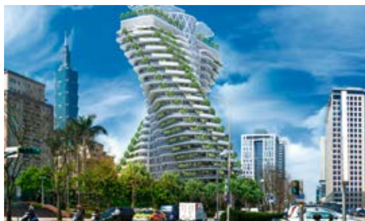
^ Жилой комплекс Agora Garden, Тайбэй, Тайвань. Архитектор Винсент Каллебот, 2010–20..?