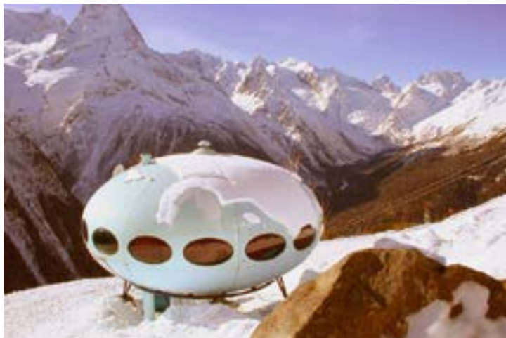
^ Северный приют, Домбай. Архитектор М. Сууронен, 1979