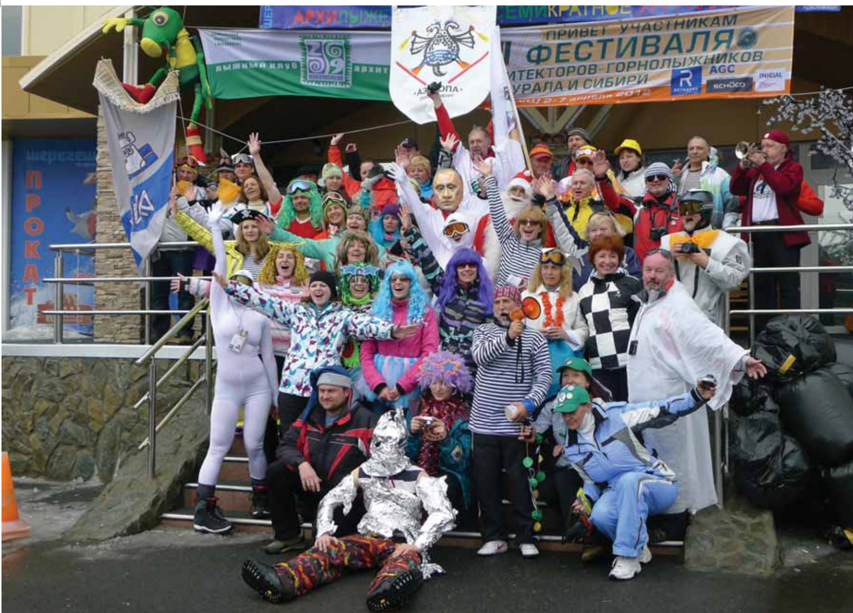
v После карнавала