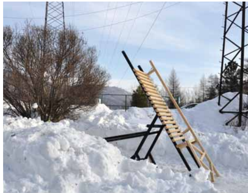
^ Инсталляция «Новый формат» (команда UnArch)