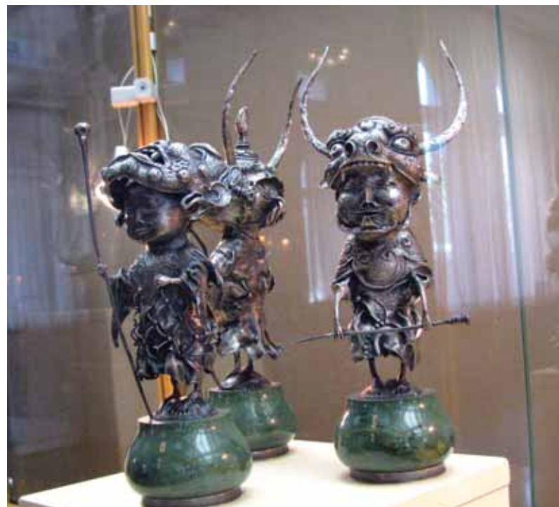
< Мистерия Цам