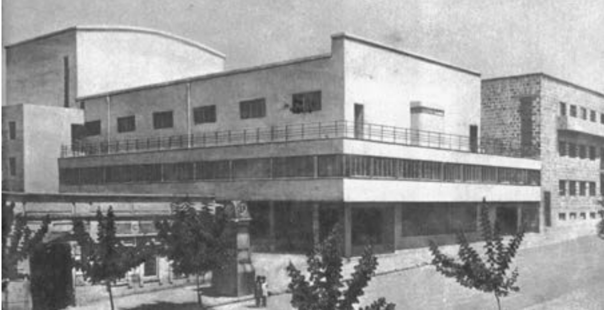
< Клуб строителей в Ереване. Арх. М. Мазманиян, Г. Кочар. 1926

новые реальные постройки уже не заказывали, а готовую строительную документацию спешно переделывали: пышные декорации на фасады пририсовывали архитекторы, которые в этом хорошо разбирались с дореволюционных времен. Конкурсы в конце 20-х годов выигрывали одни, а реализовывали их проекты, навешивая на фасады классические детали, – другие. Мягко и мирно все получилось. Объявление об учреждении ВАНО напечатано на обложке журнала «Современная архитектура» № 1 за 1930 год.