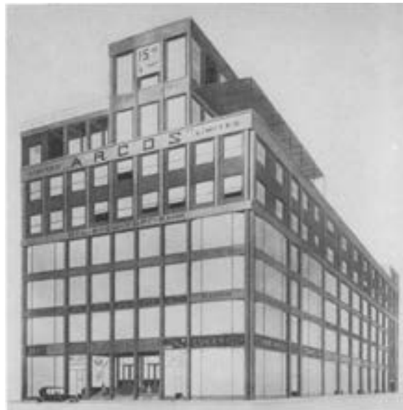
< Братья Веснины. Конкурсный проект здания акционерного общества «Акрос». 1924