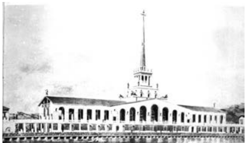
< v Морской вокзал в Сочи. Арх. Л. Карлик, инж. А. Кузьмин, скульптор А. Ингал, художник Е. Протопопов. 1950. Построен в 1954 году