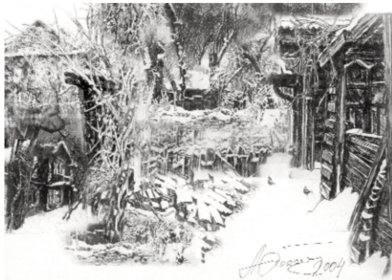
Художественный коллаж автора статьи