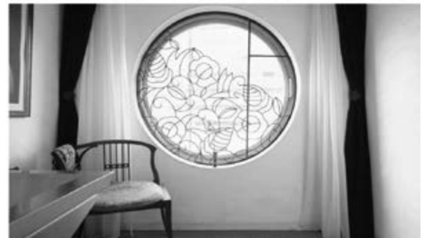
> Рис. 13а