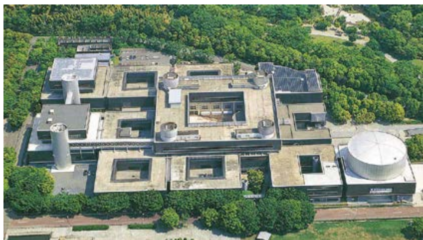
^ Рис. 2, 3