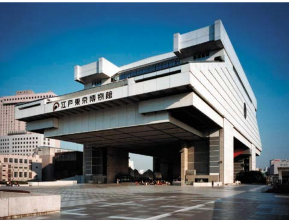
v Рис. 12а, 12в

помещения, склады для хранения вещей, а то и вовсе были заброшены. В 2007 году владельцы согласились на снос здания, но из-за финансового кризиса решение было отложено. Тогда же появилась группа активистов, стремящихся сохранить здание. Главным результатом стало привлечение иностранной помощи к сохранению башни. Немаловажную роль сыграли туристы и посетители из разных стран. Сложилась парадоксальная ситуация: постройка метаболизма стала частью достояния мировой культуры, что и подтолкнуло Японию к признанию ее исторической ценности. И только после этого началось ее непосредственное сохранение. (Рис. 13в)