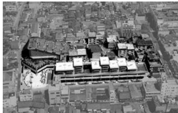
< Рис. 7а

Тем не менее, Япония славится трепетным отношением к сохранению старинных традиций и материальных ценностей. В Японии основное внимание уделяется сохранению архитектурного наследия – многочисленных храмов и святилищ, почитавшихся долгое время и многими поколениями. Методика сохранения таких памятников