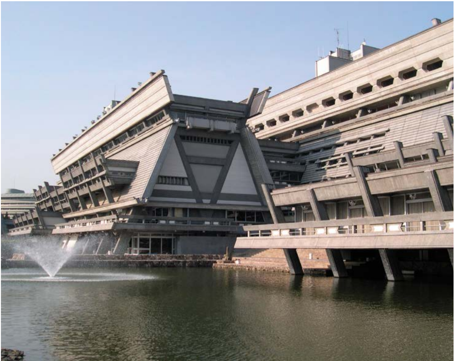
v Рис. 6

The first category that was mentioned includes buildings which are being used as museums, art galleries or art centers. By definition these buildings serve the purpose of collecting artifacts of natural history and tangible heritage, what indirectly makes them a part of this heritage. Due to promotional activities they also hold a notable value for society. Museums designed by the architects of Metabolism are often in a better condition than the buildings of other categories. These buildings include: Oita Prefectural Library (Arata Isozaki, 1964-1966) (Fig. 1a, b), Iwasaki Art Gallery (Fumihiko Maki,