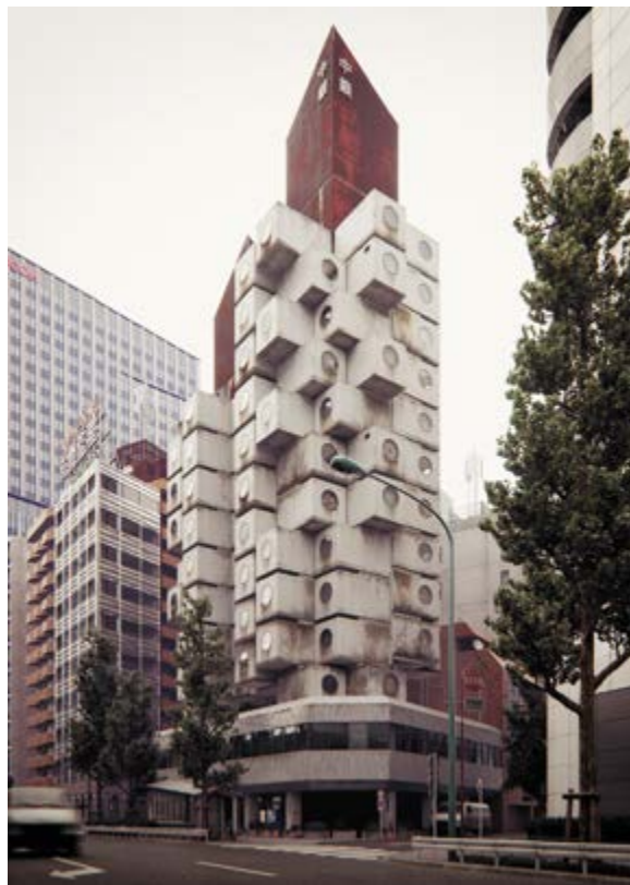
< Рис. 13а

Район Гиндза обладает богатой историей и отличается особым отношением со стороны японцев на всем протяжении своего существования. Но осознание всей исторической важности района Гиндза сложилось не из-за обилия старинных памятников: с момента появления Гиндза перестраивалась множество раз. Все дело в ценности места, занимаемого районом. Укоренение района Гиндза в истории произошло по двум направлениям: времен-