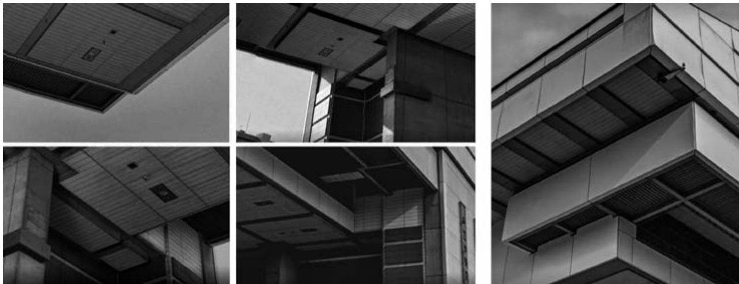
^ Рис. 12б