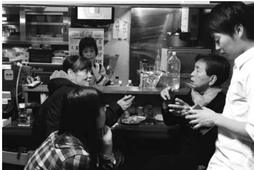
v Рис. 11а, 11б

Несмотря на то, что здание сохранилось до наших дней, оно давно пришло в негодность. (Рис. 13б) По состоянию на октябрь 2012 года, около тридцати из 140 капсул продолжали использоваться в качестве жилья, в то время как другие применялись как офисные