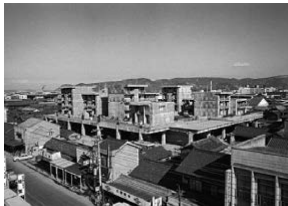
< Рис. 7б