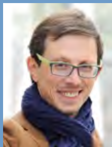
АНДРЕЙ АСАДОВ / ANDREY ASADOV автор / author

Кроме того, мы постарались соблюсти архитектурные принципы самого Сколково – инновационный облик, экологичность и комфортность среды. Наружная оболочка здания – это легкая витражная система с энергоэффективным стеклом, поверх которой надета солнцезащитная «вуаль» из ламелей. Разная плотность ламелей напоминает биение человеческого пульса, как некий образ кардиограммы. Экологический принцип мы реализовали в пространстве атриума, куда проникают природные элементы – газоны, деревья, солнечный свет. Благодаря этому, реализуется и третий принцип – создание комфортной среды для посетителей. Все элементы здания продуманы так, что в них комфортно работать, лечиться, общаться и повышать свое образование.