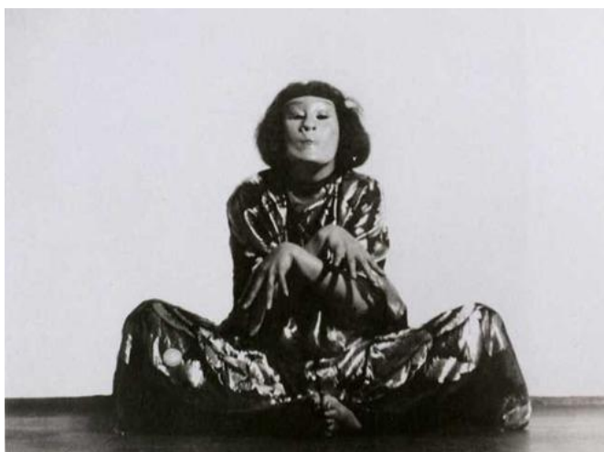
Fig. 1 – Hexentanz (1929)

Aluna também de Laban, Wigman foi uma das principais representantes da Ausdruckstanz (dança de expressão), uma espécie de antecessora do Tanztheater que inicia uma caminhada artística à qual o Tanztheater vai dar desdobramento 21 . A Ausdruckstanz não deve ser considerada uma dança expressionista por não se atrelar diretamente ao movimento em questão, porém sofreu fortes influências dele, como a utilização de gestos mais dramáticos, forte contraste entre luz e sombra, maquiagem carregada, destaque para o olhar, e a busca por expressar sentimentos, e não simplesmente contar histórias. Wigman une a investigação de movimento e a exploração da individualidade – desenvolvidas por seus professores – com o radicalismo dos expressionistas na busca por expressar conflitos da alma humana 22 .