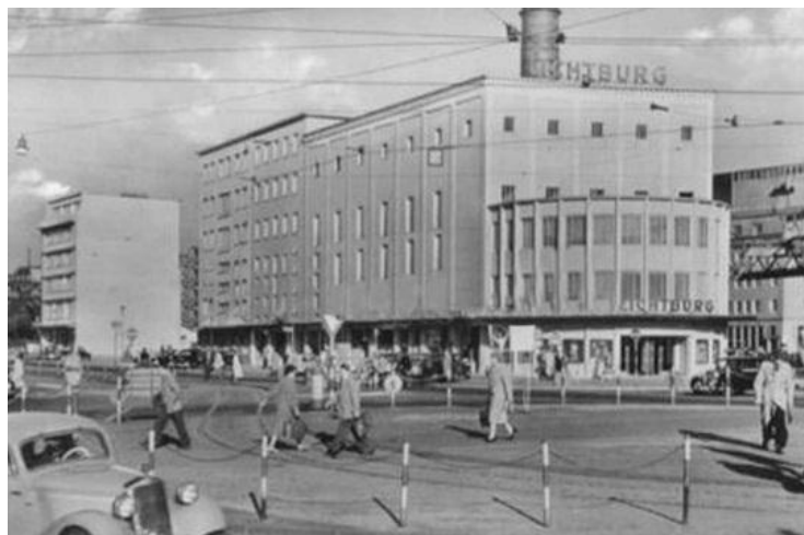
Fig. 11 – Lichtburg

Bausch se aproxima de conceitos levantados por Duchamp com seus Ready Mades 62 ao colocar objetos da vida cotidiana expostos como obras de arte, deslocados de seu contexto original, em galerias de arte e/ou museus. Assim, a coreógrafa traz elementos da vida cotidiana em seus cenários, transformando a relação dos espectadores com eles: