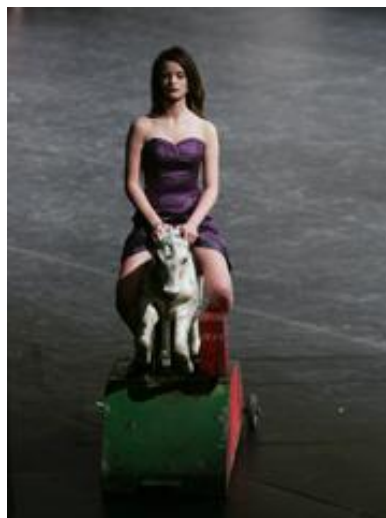
Fig. 6 – Menina sentada sobre cavalinho. Versão realizada pelos adolescentes

A cena em si se realiza de maneira “realista”, ou seja, “como se” fosse na vida real. A bailarina se coloca de maneira cotidiana, tanto ao pedir a moeda quanto na relação com o brinquedo. Porém, a cena anterior a essa foi o hip-step , cena em que todos juntos, de frente para a plateia, vão rebolando, caminhando para frente e às vezes rebolam de costas mostrando as nádegas.