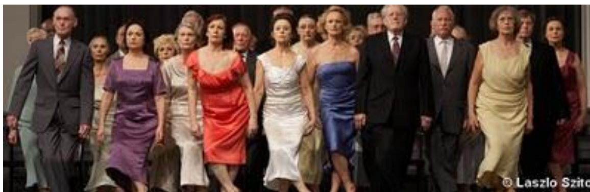
Fig. 14 – Kontakthof com senhoras e senhores

Assim, o espetáculo com senhoras e senhores continua sendo apresentado até os dias atuais 76 , passando por diversos países. Substituem-se os intérpretes de acordo com a necessidade, mas mesmo assim o espetáculo se mantém em cartaz há 11 anos.