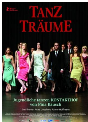
Fig. 16 – Cartaz do filme Tanzträume

adolescentes foram para o lançamento de Tanzträume , em Berlim.