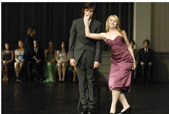
Fig. 9 – Cena das “agressões”, na versão realizada por adolescentes

circo. Apesar da “dor”, o casal continua sempre sorrindo, mantendo uma máscara social, e segue nessa apresentação de “horrores”, puxões no nariz, aperto no bico do seio e pisada no pé.