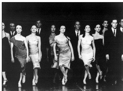
Fig. 19 – Wuppertal Tanztheater (1978)