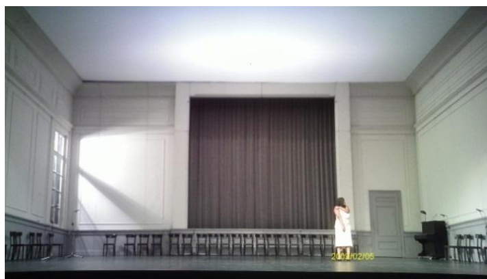
Fig. 10 – Cenário de Kontakthof . Foto da versão com adolescentes

O cenário de Kontakthof , concebido por Rolf Borzik 56 , constrói um grande salão de baile, uma espécie de cinema antigo, com um ar “retrô” 57 , remetendo à década de 1950. No fundo, um palco com uma cortina preta fechada, ao redor do espaço cadeiras simples, pretas, de madeira, encostadas nas paredes laterais.