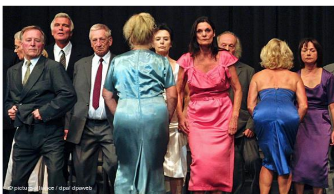
Fig. 7 – Hip-step realizado por senhoras e senhores acima de 65 anos

A cena em si se realiza de maneira “realista”, ou seja, “como se” fosse na vida real. A bailarina se coloca de maneira cotidiana, tanto ao pedir a moeda quanto na relação com o brinquedo. Porém, a cena anterior a essa foi o hip-step , cena em que todos juntos, de frente para a plateia, vão rebolando, caminhando para frente e às vezes rebolam de costas mostrando as nádegas.