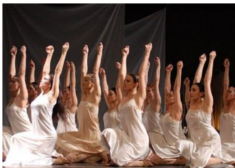
Fig. 3 – Ephigênia em Taurus

revolucionária abordagem, Bausch ainda seguia um modelo mais tradicional de dança: utilizando movimentos em coro, coreografia proposta e ensaiada basicamente por ela, e a criação da obra a partir de uma dramaturgia previamente escolhida.