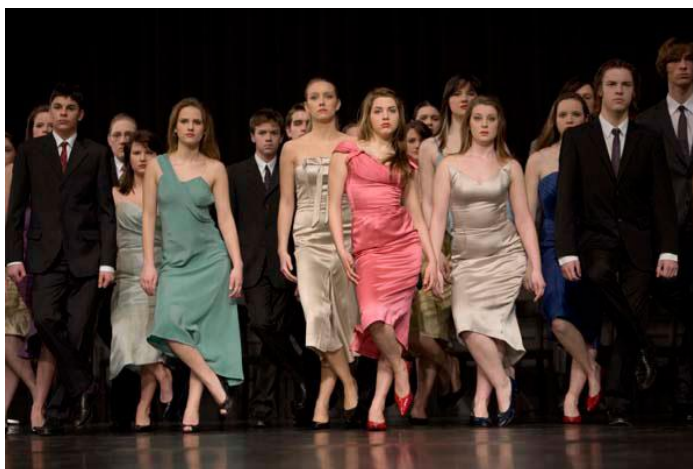
Fig. 15 – Kontakthof com adolescentes