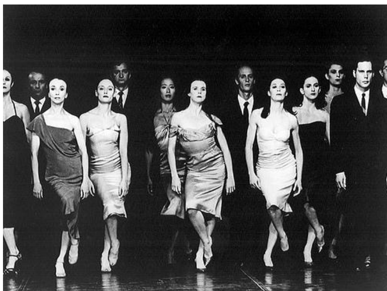
Fig. 12 – Primeira versão do espetáculo, em 1978

Em 1978, o grupo de bailarinos que construiu o espetáculo sob a direção de Pina Bausch passou por um processo de criação em que deveriam se colocar nas situações propostas pela coreógrafa e propor ações cênicas em resposta. Nenhum bailarino poderia passar impune pelo processo de criação. Na abordagem de Bausch para construção de Kontakthof , perde-se o caráter de “intérprete”, tradicional nas companhias de dança. Ou seja, um bailarino que cumpre ordens e executa coreografias. Dando lugar ao trabalho do “intérprete criador”, que se questiona, investiga e busca nas suas próprias verdades maneiras de responder às questões trazidas pelo coreógrafo-diretor.