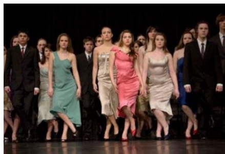
Fig. 20 – Adolescentes (2008)