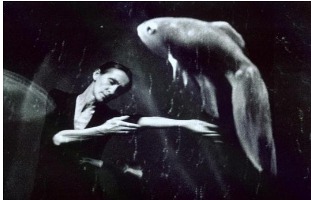
Fig. 8 – Solo de Pina Bausch em Danzón (1995)

Observa-se algo análogo no solo que Bausch realiza no espetáculo Danzón 49 (1995). Mesmo se realizando com movimentos lentos e contínuos, envolvendo-se praticamente apenas braços e tronco. Segue-se uma sequência de movimentos abstratos, que a coreógrafa realiza de olhos fechados e de maneira muito suave. O movimento emana beleza e poesia por si.