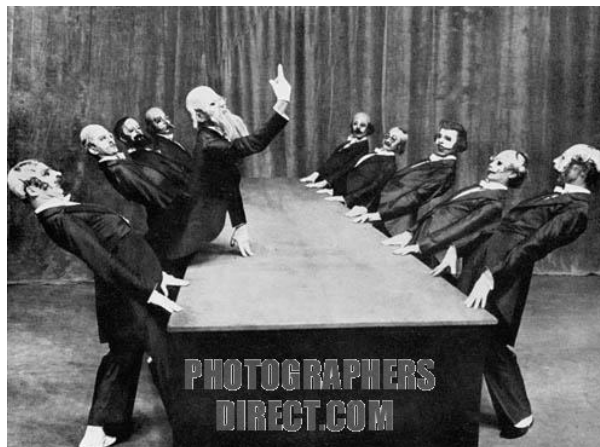
Fig. 2 – A Mesa Verde (1932)

coreógrafo e “espelho do seu tempo”. A peça foi um grande sucesso na competição, ganhando o primeiro prêmio 27 :