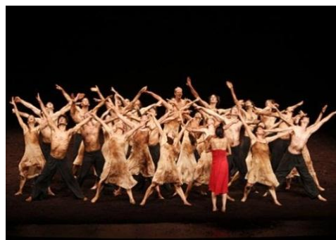
Fig. 4 – Sagração da Primavera

Sobre a abordagem de Bausch nos trabalhos criados a partir de uma dramaturgia pré-concebida, Climenhaga afirma: