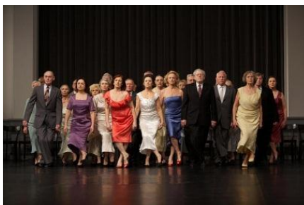
Fig. 21 – Senhoras e senhores acima de 65 anos (2000)

No dia 31 de março de 2011, quando da abertura da agenda 98 de espetáculos do Tanztheater Wuppertal, observou-se que em janeiro de 2011 estava em cartaz Kontakthof com adolescentes acima de 14 anos , em Barcelona; em fevereiro do mesmo ano estava em cartaz o mesmo espetáculo realizado por senhoras e senhores acima de 65 anos, na França. Ainda em fevereiro, novamente com os adolescentes, e em março com os bailarinos da Companhia. O mesmo espetáculo realizado por três gerações. O mesmo espetáculo, porém com uma diferente abordagem apenas pela alteração da faixa etária dos intérpretes: “O melhor de tudo, os 26 dançarinos de cada elenco emergem totalmente como pessoas, a integridade da interação deles é um testemunho do poder duradouro do legado de Bausch” (Sarah Crompton) 99 .