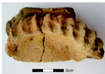
Ilustração 1 - filete digitado 42

“Nas últimas décadas, uma série de estudos sobre a cerâmica colonial, dita histórica, foram realizados, tendo sempre como referência para análise, teorias baseadas em abordagens descritivas, ocasião em que eram criadas tipologias para se enquadrarem os artefatos, visando sempre sua origem, difusão e cronologia, o que acabou resultando em tradições e fases. Apesar da importância desses trabalhos, outras abordagens começaram a ser desenvolvidas, norteadas pelas mais diversas orientações metodológicas e teóricas, buscando compreender o modo de vida das sociedades ceramistas e propondo questionamentos a respeito de sistemas socioculturais para além dessas cronologias. No Brasil, temos como exemplos trabalhos de alguns pesquisadores em sítios arqueológicos pré-coloniais como La Salvia e Brochado (1989), Wust (1990), Robrahn-González (1996) e outros (ZANETTINI, 2006)”(QUEIROZ, 2006 p. 145)