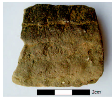
Ilustração 4 – corrugado