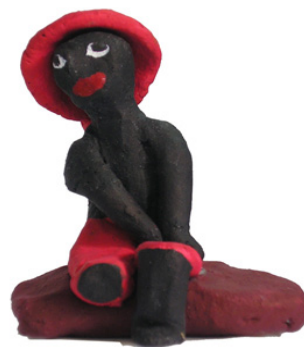
Ilustração 10 - Saci de dona Lili (São José dos Campos – 2007)