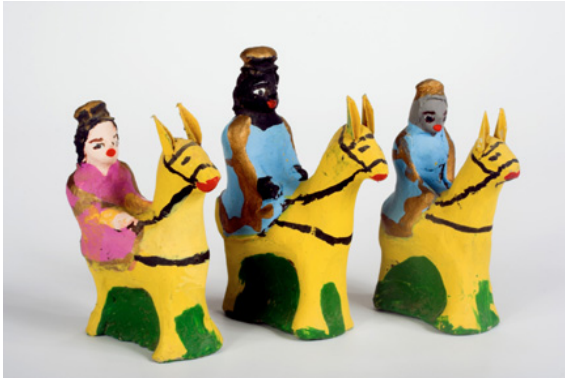
Ilustração 7 – Reis magos feitos por Dona Cida (Caçapava – 2006)