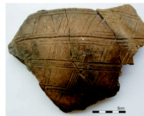
Ilustração 6 - incisa retilínea

O Vale do Paraíba Paulista apresenta dois grupos ceramistas primitivos, o Aratu e o Tupi-guarani. Queiroz (2006) destaca as diferenças no modo de produção cerâmica destes dois grupos, e Caldarelli (2003) afirma que os estudos, até o momento, não permitem conhecer se eles foram ou não contemporâneos. De qualquer maneira, as características dos modos de produção de cada grupo indicam um conhecimento das técnicas cerâmicas e, principalmente, da aplicação da argila na confecção das peças.