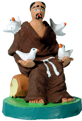
Ilustração 16: São Francisco (Vagner Santos – 2006)