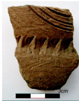
Ilustração 3 – inciso circular e estocado