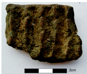
Ilustração 5 - espatulado