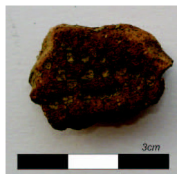
Ilustração 2 - ponteados