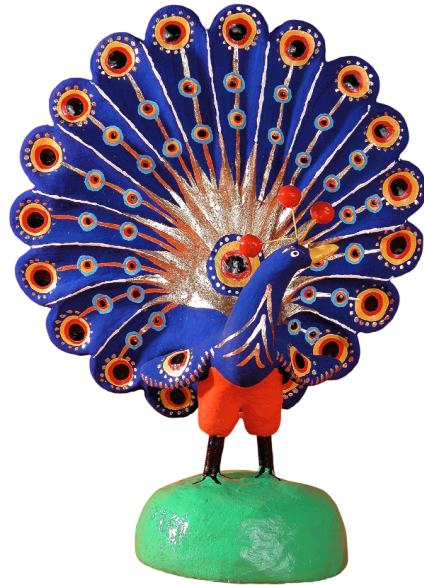
Ilustração 15: Pavão (Eduardo Santos – 2006)