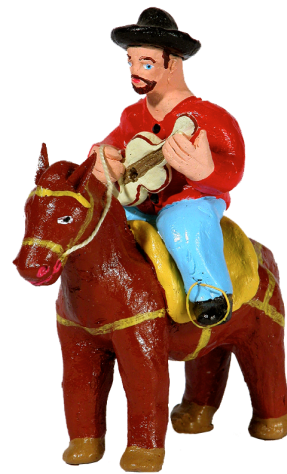
Ilustração 17 : Violeiro a Cavalo - esta peça faz parte de um conjunto de várias peças que representam a bandeira do divino (Maria Luíza Santos – 2005)