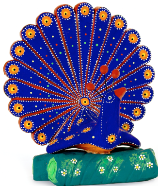
Ilustração 13 : Pavão com o azul cobalto tradicional.

“Só que até vinham os turistas na rua, mas a nossa casa era a última. Então o bonde [ônibus] vinha e parava ali, (...) [e] quando chegavam em casa, [o que era] muito difícil, eles já [havia] comprado nas outras casas, eles gastavam o dinheiro lá. Só que [quando] eles chegavam na nossa casa, não tinham mais dinheiro.” (Ângela Sampaio – p. 3 – 2005)