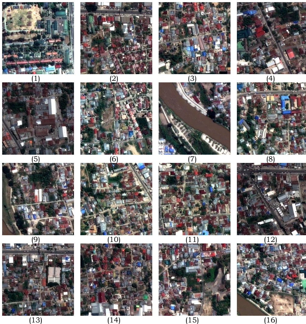
Gambar 2-1: Dataset Pleiades komposit true color yang masing-masing berukuran 512x512 piksel

Namun demikian, nilai rasio kompresi yang terlalu besar dapat menurunkan kualitas kompresi dari segi kesamaan citra sehingga mengakibatkan nilai PSNR yang kecil. Oleh karena itu, kedua parameter ini sering digunakan bersama untuk mencari metode kompresi yang dapat mengkompresi citra dengan rasio kompresi yang besar dengan tetap menjaga kualitas visual citra hasil kompresi.