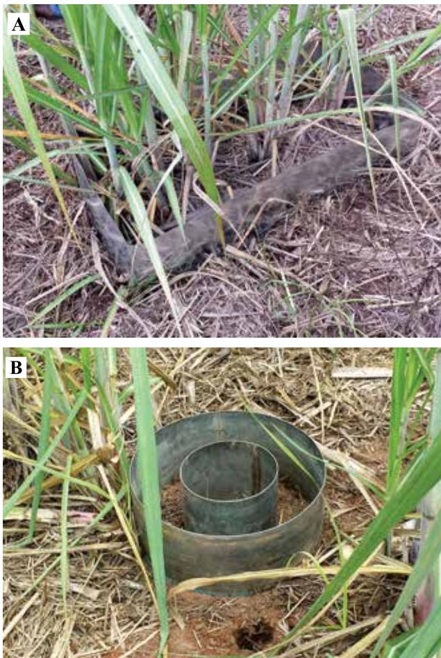
Figura 1. Experimentos realizados sob regime hídrico natural, com calhas (A), e controlado (B), com anéis concêntricos, na área de Neossolo Quartzarênico sob cultivo de cana-de-açúcar.

Em novembro de 2013, após a delimitação das áreas de estudo e coleta das amostras testemunhas, a 30 cm de cada chapa, foi aplicado o equivalente a 80 kg ha -1 de K 2 O, na forma de KCl, no interior de cada uma das áreas delimitadas. Esperou-se, então, o fim do período chuvoso para nova coleta do solo. Em abril de 2014, retornou-se à área e procedeu-se à nova coleta de amostras no interior das áreas com as chapas. Amostras compostas foram coletadas – três por ponto – com trado holandês, nas camadas de 0,0–0,10, 0,10–0,20, 0,20–0,30, 0,30–0,40, 0,40–0,50, 0,50–0,60, 0,60–0,70, 0,70–0,80, 0,80–0,90 e 0,90–1,00 m de profundidade.