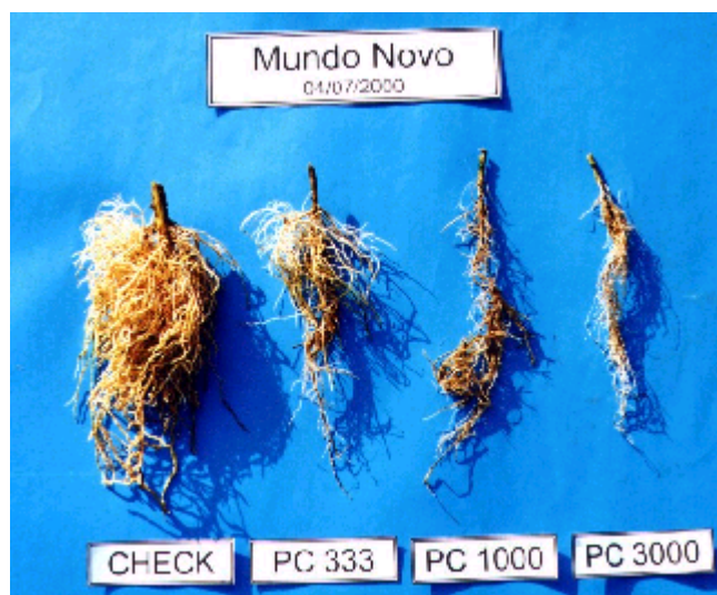
FIG. 4 - Efeito de densidades populacionais do isolado de Marília ( K_5 ) de Pratylenchus coffeae na parte aérea de cafeeiro ( Coffea arabica ) cv. Mundo Novo, aos 244 dias após a inoculação (experimento 1).