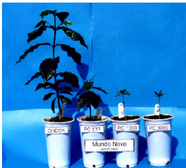
FIG. 3 - Efeito de densidades populacionais do isolado de Marília ( K_5 ) de Pratylenchus coffeae na parte aérea de cafeeiro ( Coffea arabica ) cv. Mundo Novo, aos 244 dias após a inoculação (experimento 1).

Os efeitos danosos do isolado de Marília de P. coffeae ( K_5 ) sobre o cafeeiro cv. Mundo Novo puderam ser comprovados, em primeiro lugar, pelo grande número de plantas que morreram no experimento 1. Isso pode ter sido provocado, além dos danos devidos aos nematóides, pelo estresse causado pelas altas temperaturas nos primeiros meses do período experimental (outubro de 1999 a fevereiro de 2000) e pela deficiente refrigeração na casa de vegetação de Campinas. Ainda assim, é evidente que o principal responsável pela mortalidade foi P. coffeae , pois foi nula nas testemunhas e nas plantas com 333 nematóides, e nas demais plantas foi proporcional às densidades populacionais iniciais. Embora não tenha ocorrido perda de plantas na Pi = 333 , houve uma redução drástica do peso fresco das raízes e do peso seco da parte aérea, quando comparada com a testemunha. Esse efeito também pode ser atribuído em parte ao estresse sofrido pelos