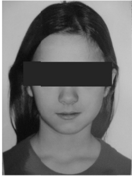
Figura 1 – registro frontal em repouso

Figuras 1 a 5 – exemplos de imagens, adquiridas através da tecla pause a fim de permitir a avaliação Fonoaudiológica e Ortodôntica, retiradas do roteiro de filmagem ROF 16