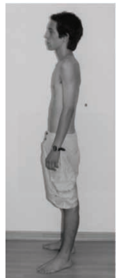
Figura 14 - Foto corporal esquerdo