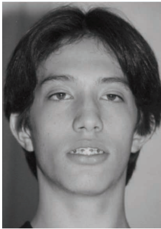
Figura 2 - Face frontal com lábios entreabertos Pós-tratamento (07/08/2003)