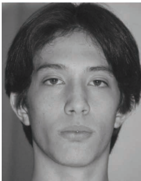
Figura 4 - Face frontal com oclusão labial Pós-tratamento (07/08/2003)