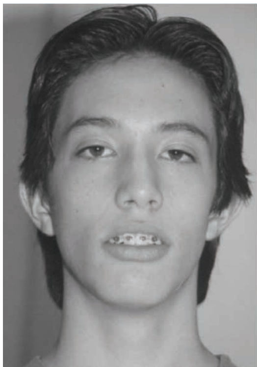
Figura 1 - Face frontal com lábios entreabertos Pré-tratamento (05/02/2003)

A Figura 15 demonstra a posição habitual da língua que neste caso encontra-se com o ápice e dorso lingual rebaixados sem vedamento posterior com palato mole 16,17 .