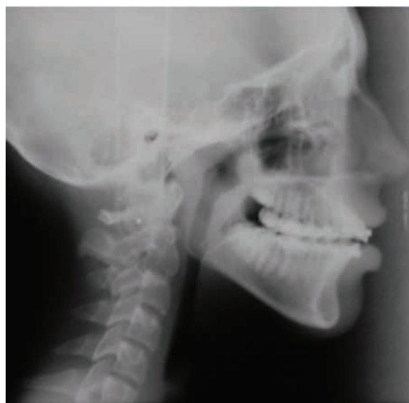
Figura 15 - Teleradiografia lateral com contraste na língua - PHL: Ápice e dorso da língua rebaixados sem vedamento posterior em palato mole