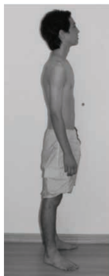
Figura 13 - Foto corporal direito