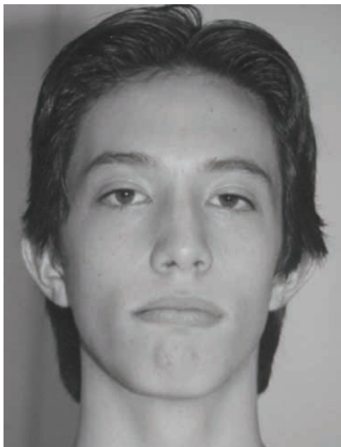
Figura 3 - Face frontal com oclusão labial Pré-tratamento (05/02/2003)