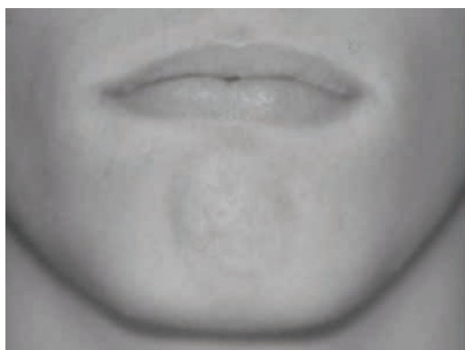
Figura 5 - Definição maior da oclusão labial Pré-tratamento (05/02/2003)