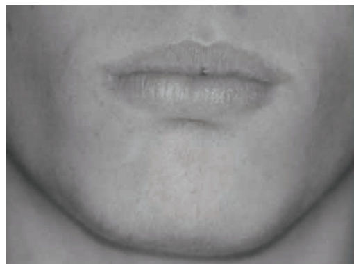
Figura 6 - Definição maior da oclusão labial Pós-tratamento (07/08/2003)