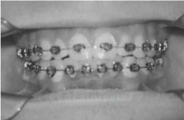
Figura 9 - Oclusão dentária Pré-tratamento fonoaudiológico (05/02/2003)