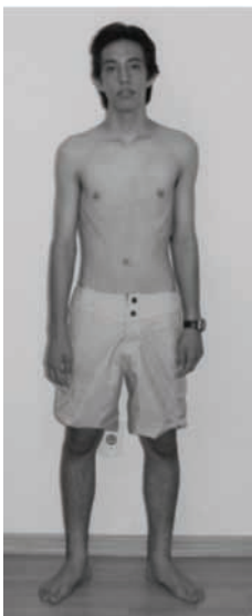
Figura 11 - Foto corporal frontal