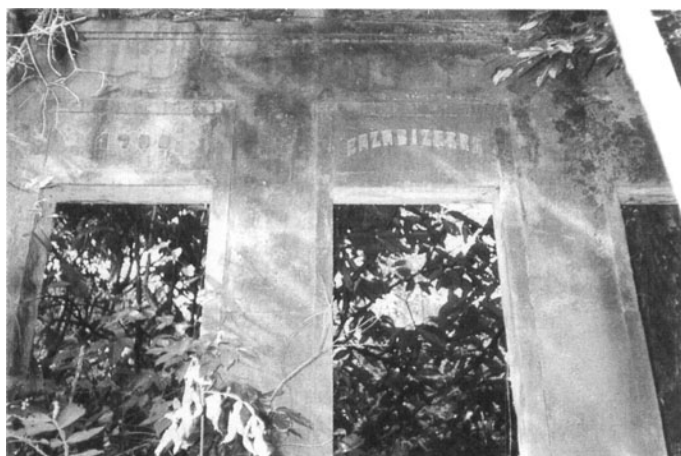
Ruínas de Santo Elias do Jaú, no Rio Negro:: uma das primeiras cidades amazônicas, fundada no século XVII.