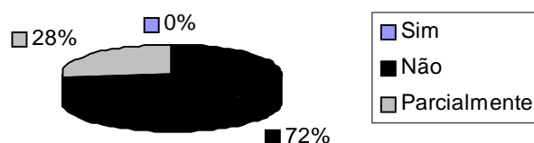
Gráfico 1. Referente à questão: "Você acha que o currículo de pedagogia aborda a questão da saúde na escola?"

A segunda questão pergunta aos respondentes sobre a possibilidade de o currículo de Pedagogia abordar a questão da saúde na escola. As respostas a esta questão estão demonstradas no Gráfico 1: