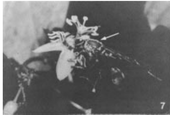
Figura 7. Flor de Passiflora suberosa sendo visitada pela vespa Mischocyttarus interjectus . Há pólen depositado sobre a cabeça e as partes laterais do tórax da vespa.

A antese das flores no início da manhã não é regra geral para as espécies melitófilas de Passiflora , pois as flores de P. incarnata (May & Spears 1988) e P. edulis (Sazima & Sazima 1989) abrem entre 11:00 e 14:00 h. Sazima & Sazima (1989) sugerem que este período de abertura seja uma estratégia para evitar a sobreposição de polinizadores, com outras espécies de Passiflora sincronopátricas cujas flores abrem ao amanhecer. O fato das flores de P. capsularis permanecerem abertas até às 13:00 h, permite, à semelhança do que ocorre em P. mucronata (Sazima & Sazima 1978), a polinização também por insetos