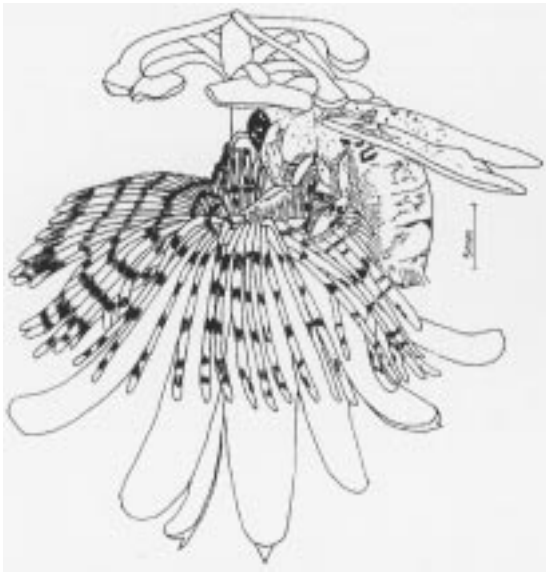
Figura 6. Esquema da flor de Passiflora miersii sendo visitada por Xylocopa brasilianorum . A abelha contacta as anteras e os estigmas com o dorso do tórax.

definida para flores polinizadas por vespas, alguns atributos de P. suberosa , tais como flores pequenas e rasas, com cores opacas e néctar de fácil acesso, correspondem aos descritos para flores polinizadas por vespas em Faegri & van der Pijl (1980) e Heithaus (1979). As características florais de P. capsularis correspondem à síndrome de falenofilia (Faegri & van der Pijl 1980). Um dos atributos mais evidentes seria o guia de língua, formado pelos sulcos do límen perpendiculares à câmara nectarífera, que acompanham as dobras do opérculo. Estes guias são estruturas especializadas, encontradas geralmente em flores polinizadas por lepidópteros (Faegri & van der Pijl 1980).