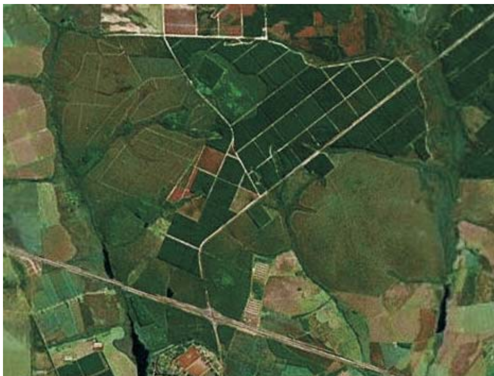
Figura 1 – Imagem da Estação Ecológica de Santa Bárbara (EESB) do Instituto Florestal do Estado de São Paulo orientada com o norte no alto. Seus limites ao Leste e ao Oeste são córregos afluentes do rio Pardo. Ao norte, uma estrada com direção leste-oeste separa os talhões de Pinus e Eucalyptus da EESB (no alto ao centro e à direita na imagem) e o Cerrado da EESB (no alto à esquerda na imagem), de propriedades particulares. No extremo sul, os limites da EESB na mancha urbana de Águas de Santa Bárbara abaixo da rodovia SP 280 - Castelo Branco, que corta a imagem com direção leste-sudeste a oeste-noroeste. Ao sul-sudeste, os limites são com campos de cultivo e pastagens, acima da SP 280. Dentro de seus limites, as áreas poligonais são talhões de Pinus e Eucalyptus . As demais áreas são de Cerrado sensu lato , do verde mais escuro ao sul (Cerrado sensu stricto ) ao verde menos escuro (campos), exceto nas linhas de drenagem, onde ocorrem Matas de Galeria.

Figure 1 – Image of Santa Barbara Ecological Station (EESB) - São Paulo Forest Institute, with the north at the top. The EESB east and west limits are streams that flow to the Pardo River. In the north, a road separates the EESB's Cerrado and EESB's Pinus and Eucalyptus plantation from the private areas. At bottom, below the SP280 highway, the limit is Aguas de Santa Barbara town. Other EESB limits neighboring crop fields and pastures. Deep green polygonal areas inside EESB are Pinus and Eucalyptus plantations. Other green areas of Cerrado are denser than deeper, except along the streams, where gallery forests grow.