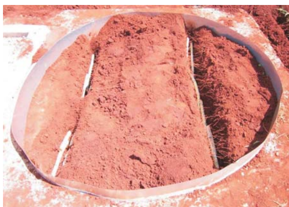
Figura 3 - Plantio da cana-de-açúcar.

0,50 m, promovendo 2,0 m de largura efetiva. O equipamento foi operado a 2,78 kgf cm -2 (40,0 psi), empregando água como diluente e volume de aplicação de 200 L ha -1 ou 2 L 100 m -2 (calibração efetuada no local, em função da velocidade do aplicador em relação à área trabalhada). O preparo da calda foi de 2 litros para 100 m 2 . Assim, a aplicação de 400 mL de