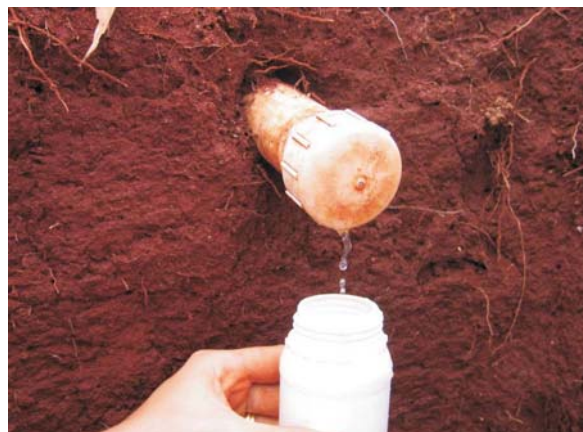
Figura 4 - Coleta das amostras.

para detecção de resíduo de tebuthiuron na água de chuva foi Cromatografia Líquida de Alta Eficiência – CLAE.