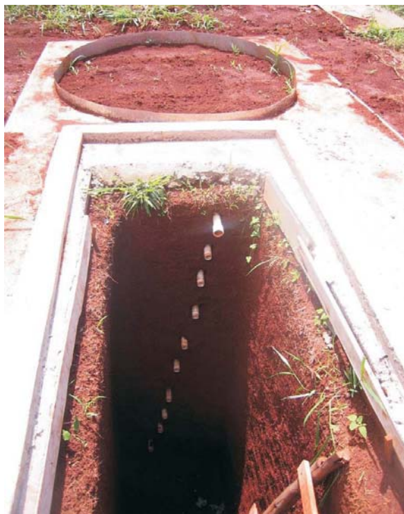
Figura 1 - Lisímetro montado no campo experimental da FEAGRI (fevereiro 2006).