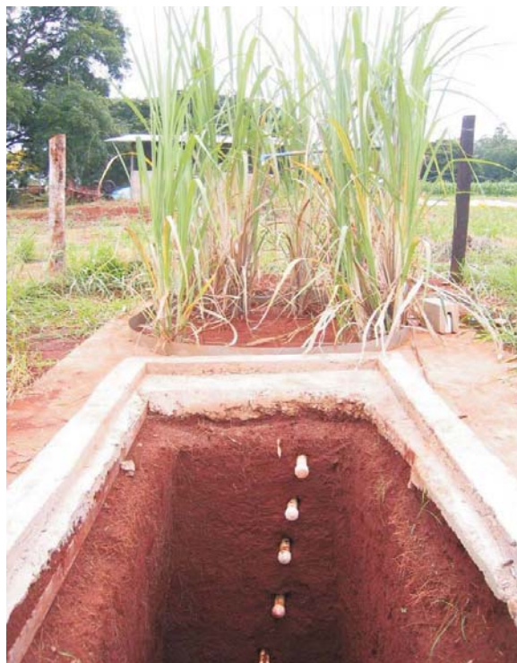
Figura 2 - Lisímetro montado no campo experimental da FEAGRI (janeiro 2007).