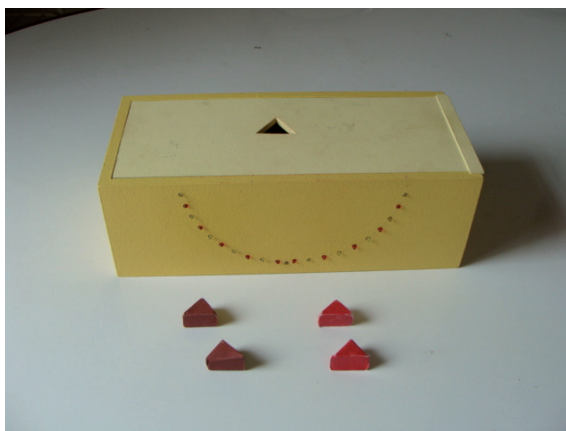
Figura 2 - Recurso pedagógico de encaixe com tampo e peças em prismas triangulares de tamanho pequeno