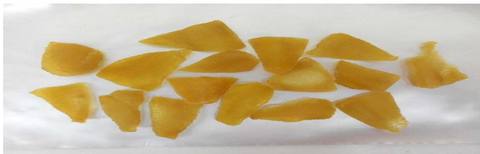
Gambar 2. Manisan kring buah carica dengan lama pengeringan 10 jam

kering buah carica disajikan pada Gambar 2.