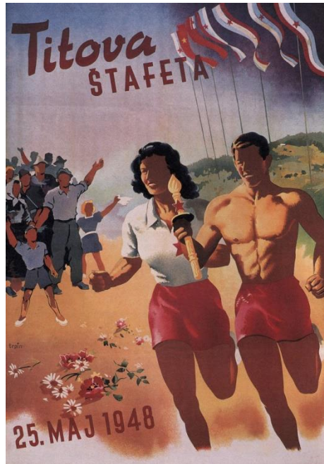
Слика 2. Плакат поводом Титове штафете 1948. године. 591

Мушкарац и жена, обоје фискултурници, заједно трче, индентичним покретом ногу. Жена у спортском шортсу, за то време кратком, и што је нарочито значајно индентичним као мушкарчевим. Мускулатура јој је видно развијена, мишићи ногу и подлактице чак идентични као мушкарчеви. Горе, раскопчана поло мајца и распуштена коса која се уз уз осмех фискултурнице вијори док она трчи ка новом добу: добу равноправности које поздрављају масе радника, сељака и деце која се виде у позадини. Плакат је истински велики, барем пропагандни, помак али ипак јасно доминантнију улогу има мушкарац јер је он тај који носи штафету, у пренесеном значењу гради социјализам, а жена га подупире. Плакат је био и позив женама да се укључе у манифестацију јасно им стављајући до знања да их очекује готово подједнака слава као мушким носиоцима штафете.