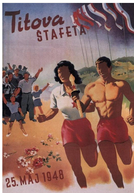
Слика 1. Плакат поводом Титове штафете 1948. године. 304

Идеализовани двојац уочљиво снажне мускулатуре носи штафету док их поздравља група људи у чијим првом редовима се налази радник поред двоје деце. Иза радника уочљиве су и друге старосне генерације али и сељаци симболизујући тако јединство читаве државе око палице са видно истакнутом петокраком. Спортски елемент је јасно уочљив али и у другом плану наспрам идеолошког. Сваки детаљ плаката морао је имати изразито социјалистичко обележије, са југословенским специфичностима. У току израде плакат је враћен на дораду, била је само једна примедба: „Ставити звезде на заставама где их нема“. 305