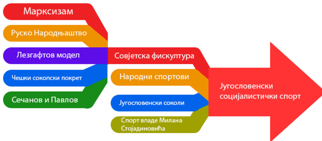
График 3. Комплетно идејно извориште југословенског социјалистичког спорта.

Дубоке промене које је 1948. носила са собом одразиле су се и на спорт Југославије. Спољнополитичку диманику анализираћемо у засебном поглављу а сада ћемо се фокусирати на идеолошку. Свакако, треба имати у виду да иако је сама држава до 1948. била доминатно оријентисана на Источни блок, спортски стручњаци долазили су са разних идеолошких позиција. Део њих школовао се на Западу као стипендисти и