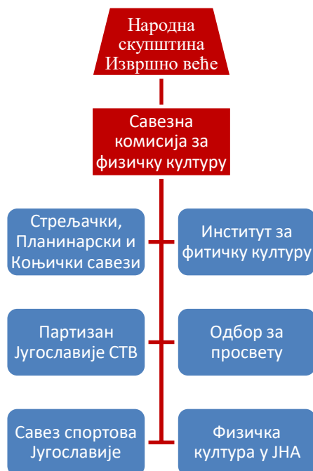
График 5. Организација физичке културе у Југославији.

Са друге стране, погрешно би било исувише озбиљно узети наведену организацију спорта. У годинама после рата држава се влашћу која није била нити јасно дефинисана нити јасно организована – била је револуционарна. Званичне функције немају толики значај већ конкретан утицај појединца у оквиру Партије, што се најбоље огледа у значају који је у тим годинама заузимао Политибиро у контексту званичних политичких функција његових чланова. Ипак, темељ организације југословенског спорта је постављен, сагледајмо сада његову реализацију.