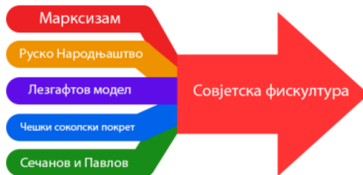
График 1. Идеје које су формирале совјетски спорт.

Освојивши власт 1917. године Лењин је добио и прилику да преузме и праксу спорта нове државе. Циљ је био нови човек: Homo Sovieticus, који је морао бити здрав и свестрано развијен. 207 Спорт је имао улогу средства за постизање овог циља, а као