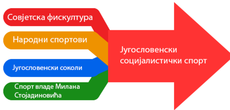
График 2. Изворишне идеје југословенског социјалистичког спорта.

Ако бисмо и дубље сагледали совјетски спорт, комплетно идејно извориште социјалистичког спорта Југославије, до 1948. изгледа овако: