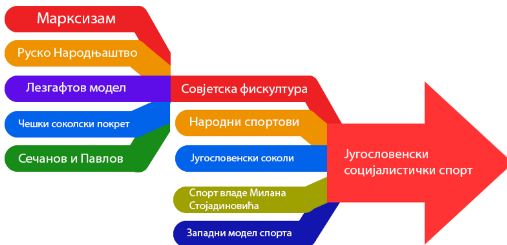
График 4. Идејни утицаји који су формирали југословенски социјалистички спорт.

Циљ новог спорта био је формиран према циљу самог социјализма – комунизму. Требало је изградити новог човека, Homo Sovieticus–а или Homo Yugoslonicus–а, за ново доба. С обзиром да је крајњи циљ социјалистичке Југославије био истоветан крајњем