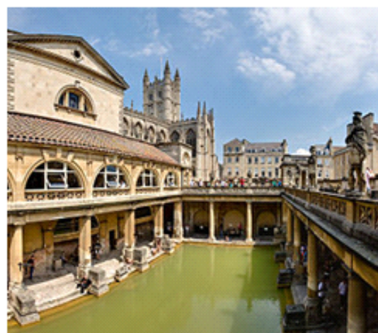
Gambar 2. Aquaduct dan Thermae .