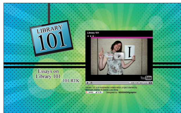
Figura 2. Library 101, http://www.libraryman.com/library101/