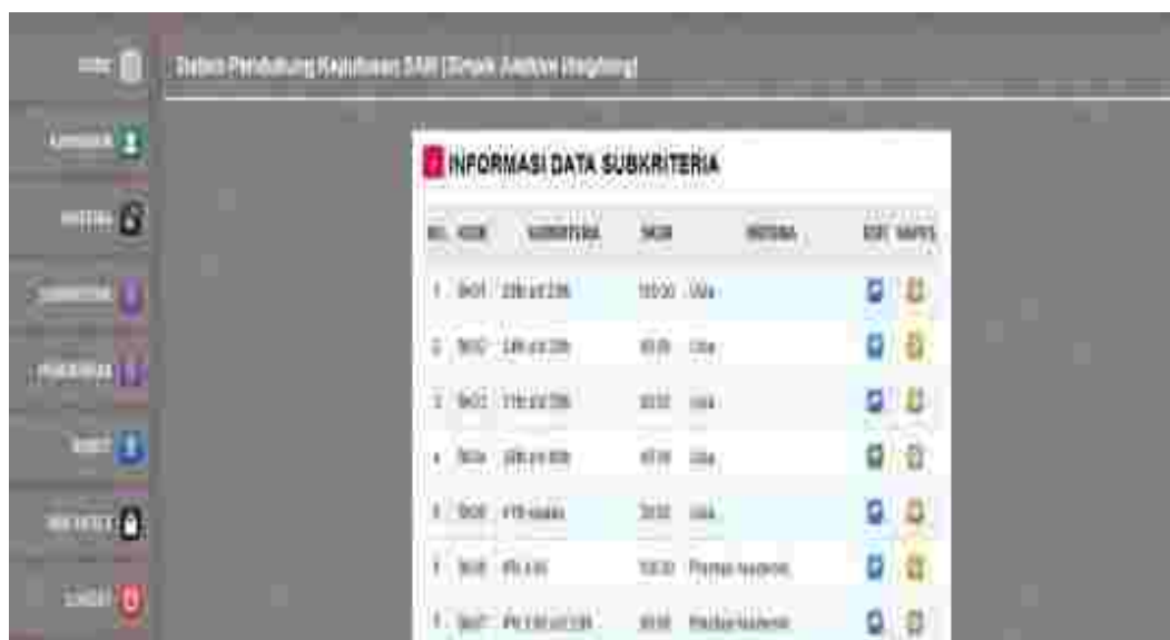
Gambar 5: Tampilan Halaman Olah Data Subkriteria

subkriteria, untuk mengakses halaman ini user dapat mengklik link Subkriteria penilaian yang terdapat pada halaman administrator sistem :