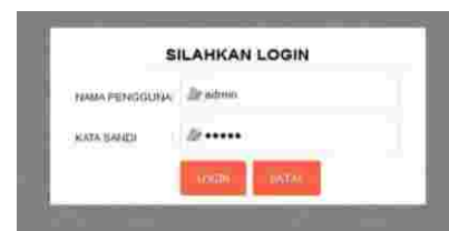
Gambar 2: Tampilan Halaman Login Ke Sistem

Adapun tampilan halaman login ke sistem dapat dilihat pada gambar berikut ini :