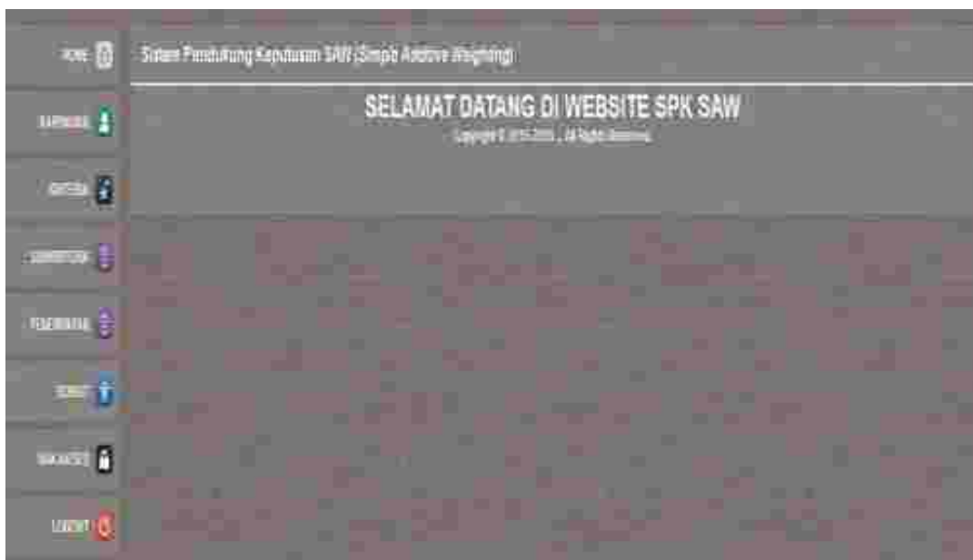
Gambar 3: Tampilan Halaman Administator Sistem

Halaman administrator sistem ini merupakan halaman yang digunakan khusus oleh user sah untuk mengelola data-data kebutuhan sistem, di dalam halaman ini terdapat link-link yang dapat digunakan oleh user sah untuk mengakses halaman-halaman pengolahan data maupun proses data kebutuhan sistem. Adapun tampilan halaman administrator sistem dapat dilihat pada gambar berikut ini :