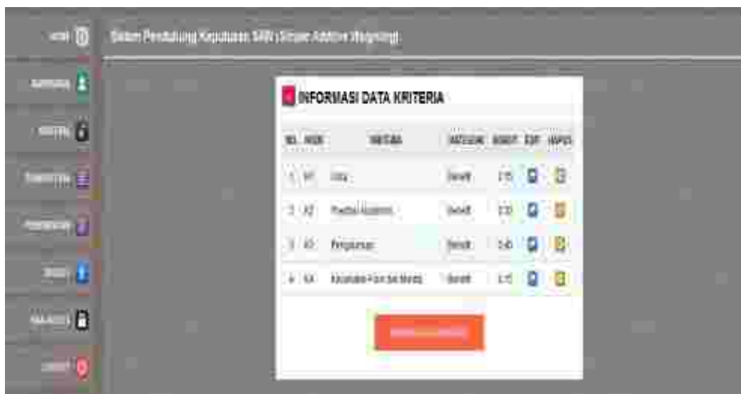
Gambar 4: Tampilan Halaman Data Kriteria

pengolahan data kebutuhan dan proses penilaian, untuk mengakses halaman ini user dapat mengklik link kriteria penilaian yang terdapat pada halaman administrator sistem. Adapun tampilan halaman olah data ini dapat dilihat pada gambar berikut :