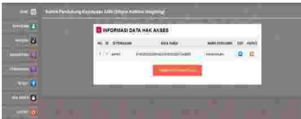
Gambar 10: Tampilan Hak akses

terdapat pada halaman administrator sistem. Adapun tampilan halaman olah data ini dapat dilihat pada gambar berikut :