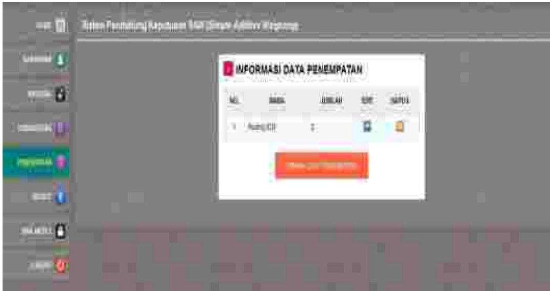
Gambar 6: Tampilan Halaman Olah Data Penempatan