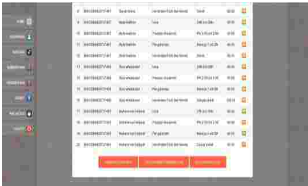
Gambar 7: Tampilan Halaman Olah Data Pembobotan

mengakses halaman ini user dapat mengklik link pembobotan yang terdapat pada halaman administrator sistem. Adapun tampilan halaman olah data ini dapat dilihat pada gambar berikut :