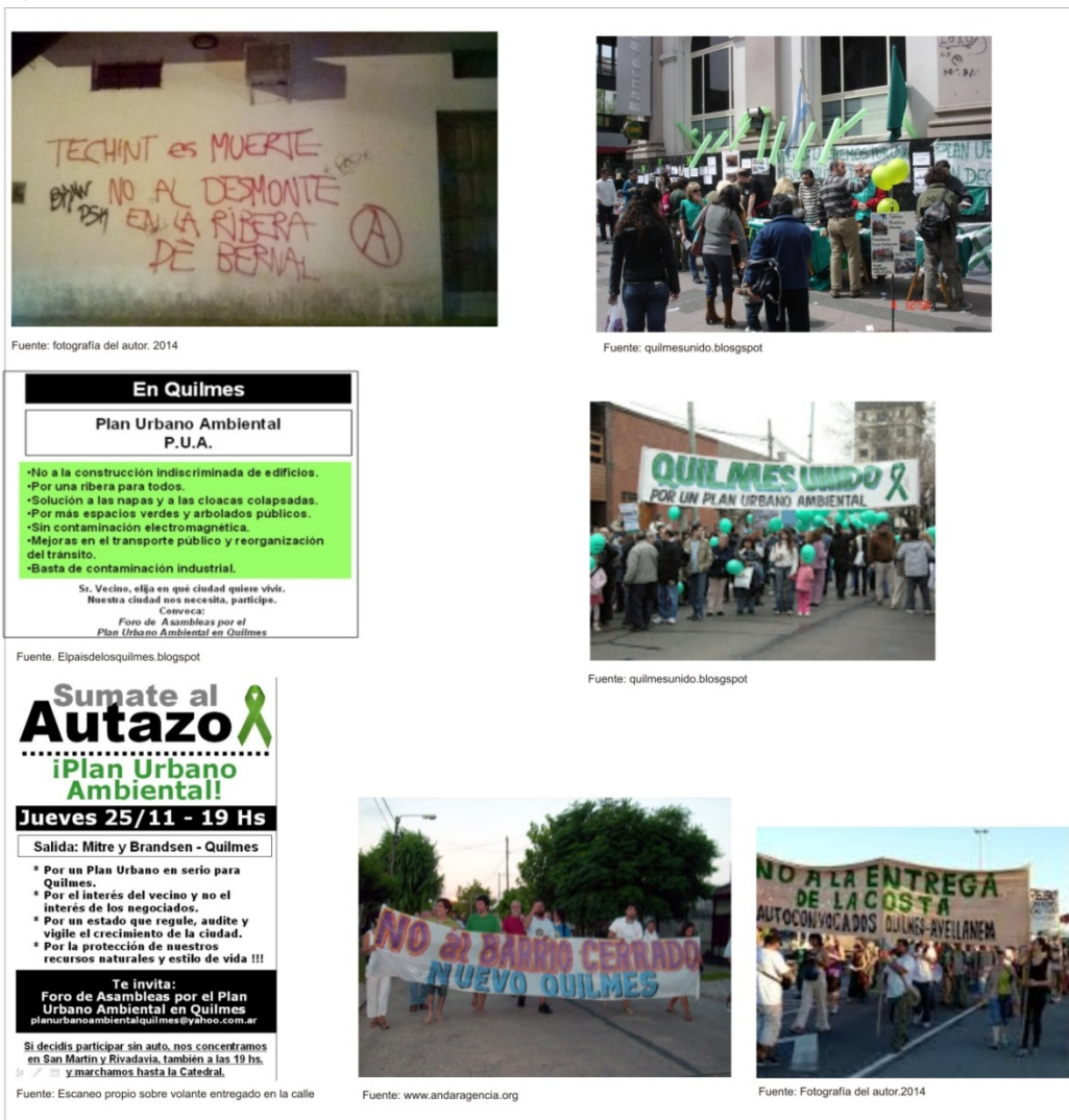
Figura 3. Actores reactivos en Quilmes.