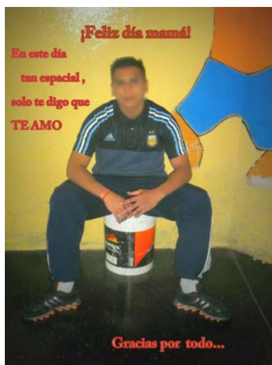
Figuras 4 y 5

Como siempre, están con sus mejores ropas de estilo deportivo que son las permitidas por los reglamentos internos y bien afeitados 12 . El plano elegido, en su mayoría, es el plano entero donde se muestran por completo, especialmente la vestimenta y el calzado, una preocupación constante que muestra el nivel de manejo de dinero que, tratándose de adolescentes que provienen de sectores muy pobres de las localidades populosas del conurbano bonaerense, puede ser leído como una pretensión a estar en una posición jerarquizada, en directa relación con el nivel de destreza en el mundo delictivo. Solo algunos eligen el plano americano dejando mucho espacio arriba para escribir allí. En estos casos, la gestualidad de las manos será protagonista.