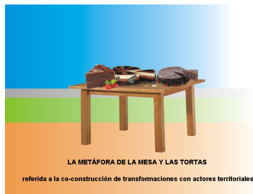
Figura 3: Inteligencia Territorial latinoamericana.

Concebimos las políticas públicas co-construidas en democracias más democráticas que las dominantes, con las “cuatro patas de la mesa” de la Inteligencia Territorial latinoamericana, así como de manera más horizontal. Tres patas referidas a los pilares de la regulación en Max Weber: instituciones públicas, comunidades y mundo empresario; mientras que la cuarta pata refiere a la justicia cognitiva, básicamente con una ciencia inscripta en un paradigma emergente . La tabla de la mesa es el ambiente. Según nuestra perspectiva el territorio -básicamente una coconstrucción y codestrucción social-natural y natural-social- es el conjunto de las patas y la tabla. Las tortas son los proyectos que elige el colectivo: sus capas son la paciencia para ir co-construyendo transformaciones a partir de muchísimas micro-transformaciones, micro-logrps y micro-fracasos incorporando amor, poder y miserias. Los colores de fondo refieren a las cuatro aristas de nuestra Perspectiva EIDT: sujetos, objeto-proyecto-proceso, métodos y técnicas, y sueños, proyección, transformación.